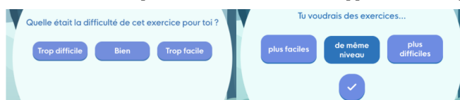
Fig. 1: Énoncé demandant la difficulté perçue (gauche) puis la difficulté voulue (droite). Ici l'élève a sélectionné "de même niveau", ce qui a affiché un bouton de confirmation dessous.

d'auto-régulation de leurs élèves sont marginaux, ce qui aurait pu limiter leurs réponses dans la suite du questionnaire. Nous avons rappelé aux enseignants ce