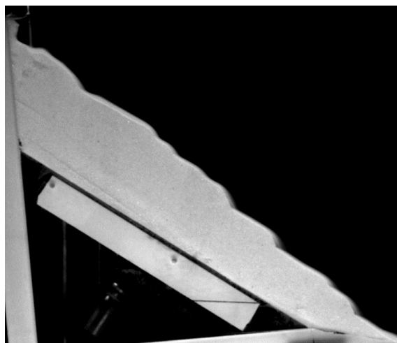
FIG. 1 – Vue latérale de l'expérience d'érosion. On peut voir la déstabilisation de la forme du tas.

Mots clefs : milieux granulaires, ponts capillaires, instabilité, érosion.