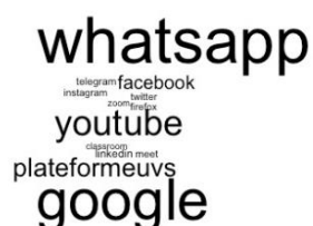
Figure 1 : Nuage de mots illustrant les réseaux sociaux déclarés

Pour les 400 étudiants ayant déclaré utiliser les réseaux sociaux dans leurs activités d'apprentissage, la figure 1 montre les réseaux sociaux les plus utilisés. Nous notons que le réseau social déclaré le plus utilisé est WhatsApp, suivi de Google, puis viennent YouTube et Facebook. Remarquons cependant que la plateforme de formation à distance de l'UVS, qui n'est pas un réseau social au sens de ceux déjà évoqués, est plus citée dans les réponses des étudiants que ne l'est Facebook.