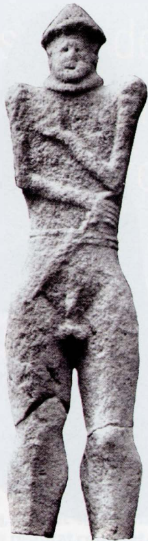
1. Personnage masculin, grès, hauteur actuelle 150 cm, Hirschlanden (Kr. Ludwisburg, Bade-Wurtemberg, Allemagne), Bonenfant et Guillaumet 1998.