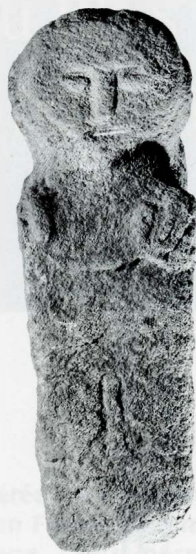
1 Personnage masculin, grès, hauteur 55 cm, Mont-Saint-Vincent (Saône-et-Loire, France), musée Denon à Chalon-sur-Saône, Photo Bibracte, A. Mai/lier.