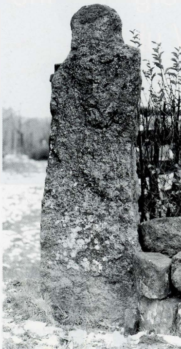
2 Monolithe anthropomorphe, grès, hauteur hors sol 170 cm, Mont-Saint-Vincent (Saône-et-Loire, France), Photo Bibracte, A. Mai/lier.