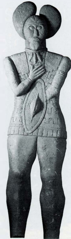
3. Personnage masculin, grès, hauteur actuelle 180 cm, Glauberg (Hesse, Allemagne), Landesamt für Denkmalpflege Hessen, Abt Archéologie