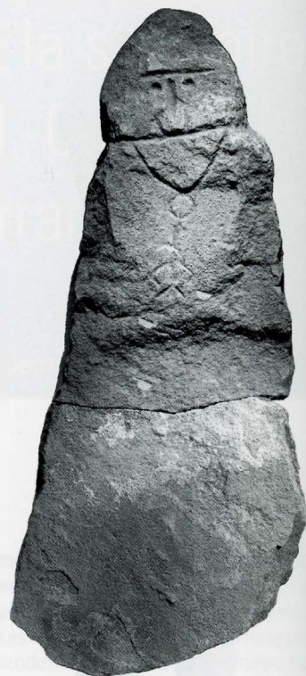
2 Personnage féminin, grès, hauteur: 123 cm, Rottenburg am Neckar (Kr. Tübingen, Bade-Wurtemberg, Allemagne), photo Landesmuseum, Stuttgart.

l'art symbolique, quant à lui, renvoie à un code conventionnel impliquant un milieu de diffusion organisé et donc, en quelque façon, un enseignement structuré. Dans les représentations de ce style, l'image de l'être humain, réduite à des schémas bien nets, prend toute sa puissance. Le programme représentatif vise avant tout la tête et, dans une moindre mesure, le torse, les bras, éventuellement le sexe. Le reste du corps est traité en pilier ou en dalle. La silhouette générale reproduit les proportions du corps. La tête est en bas-relief et les autres éléments sont gravés. L'art symbolique retient un choix iconographique précis d'éléments correspondant à un code conventionnel qui implique un enseignement tant soit peu structuré.