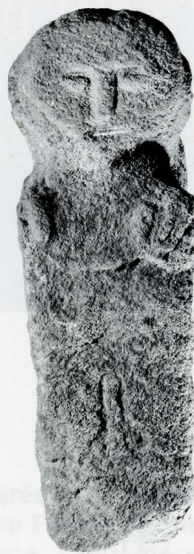
1 Personnage masculin, grès, hauteur 55 cm, Mont-Saint-Vincent (Saône-et-Loire, France), musée Denon à Chalon-sur-Saône, Photo Bibracte, A. Mai/lier.