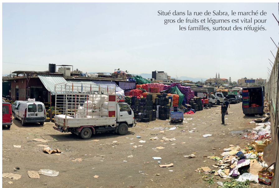
Situé dans la rue de Sabra, le marché de gros de fruits et légumes est vital pour les familles, surtout des réfugiés.