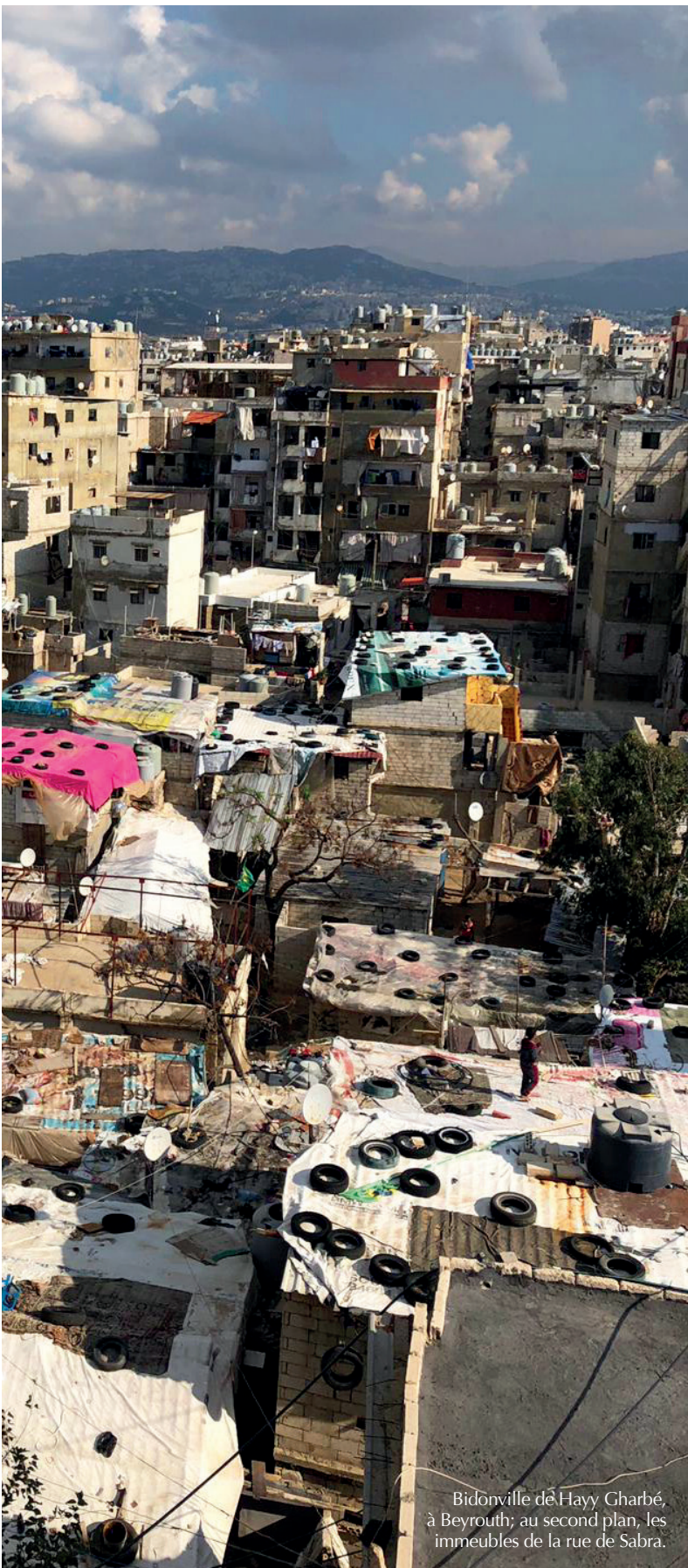
Bidonville de Hayy Gharbé, à Beyrouth; au second plan, les immeubles de la rue de Sabra.

connu de nombreux Syriens ayant travaillé à Beyrouth avant 2011. Beaucoup y ont rejoint un parent, un ami ou un ancien voisin déjà présent sur place, ce qui a pu faciliter la recherche d'un logement et parfois d'un travail. L'attractivité du quartier vient aussi de sa proximité avec des espaces d'activités économiques, comme Bourj Hammoud, la zone industrielle de Sed el-Baouchrieh, le « marché du dimanche » ( Souk al-Ahad ) de Sin el-Fil et la zone portuaire ; Nabaa constituant lui-même un secteur économique important pour les Syriens, en particulier dans le commerce et l'artisanat, où ils sont majoritaires, aussi bien comme employés ou vendeurs que comme commerçants. Enfin, le quartier accueille une trentaine d'ONG et d'associations auxquelles les Syriens, principalement les femmes et les enfants, ont recours.