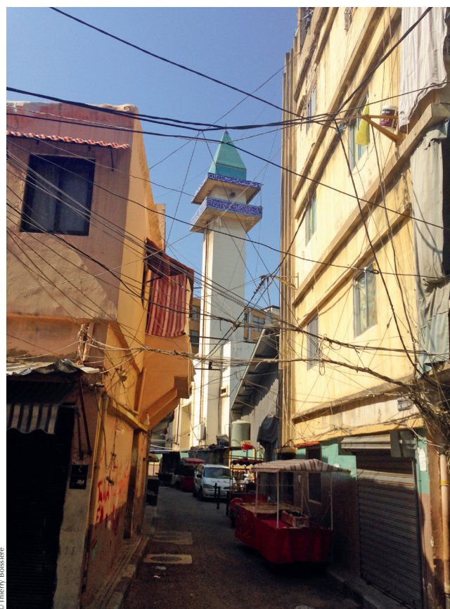
Mosquée chiite dans le quartier de Nabaa.

Le marché de gros constitue aussi un espace qui s'inscrit dans des relations de proximité à un niveau très local. Ces relations participent de la survie quotidienne d'une population extrêmement démunie, en grande partie syrienne, et dont les lieux de vie jouxtent le marché. L'un des secteurs concernés est le bidonville de Hayy Gharbé. Situé au nord-est du marché, il s'agit d'une zone depuis longtemps occupée par une population dom (branche orientale des Roms), mais qui accueille depuis 2011 des réfugiés syriens. Le marché de gros constitue pour eux un espace ressource central. Deux à trois fois par semaine, des femmes syriennes (mais aussi doms et sri-lankaises), issues de Hayy Gharbé (et de Sabra) se regroupent pour se rendre au marché. Si ces regroupements permettent de faire des achats groupés de fruits et légumes et d'obtenir ainsi les prix les plus bas, ces femmes cherchent aussi à récupérer les produits abîmés que les commerçants ne peuvent pas vendre, et qu'ils acceptent de leur céder ou dont ils se débarrassent dans le dépotoir du marché. Ces formes de glanage et de récupération aboutissent à une mise en commun et à une répartition au sein même de ces groupes, et parfois au-delà, dans le cercle plus large des réseaux de connaissances à l'intérieur du quartier. Les produits sont rapidement consommés, ou transformés en conserves, et alors revendus par ces femmes sur le marché de Sabra.