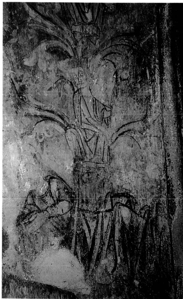
ÉBRASEMENT DROIT DE LA BAIE AXIALE : ARBRE DE JESSÉ

Le décor de La Croix-au-Bost est probablement légèrement antérieur à celui de Paulhac, et d'inspiration plus traditionnelle : on y trouve bien le même ruban large de peltes, mais il y est surmonté d'une guirlande de palmettes ; les croix de consécration doivent beaucoup à l'enluminure ; les inscriptions sont nombreuses ; les visages, triangulaires, sont plus allongés et plus