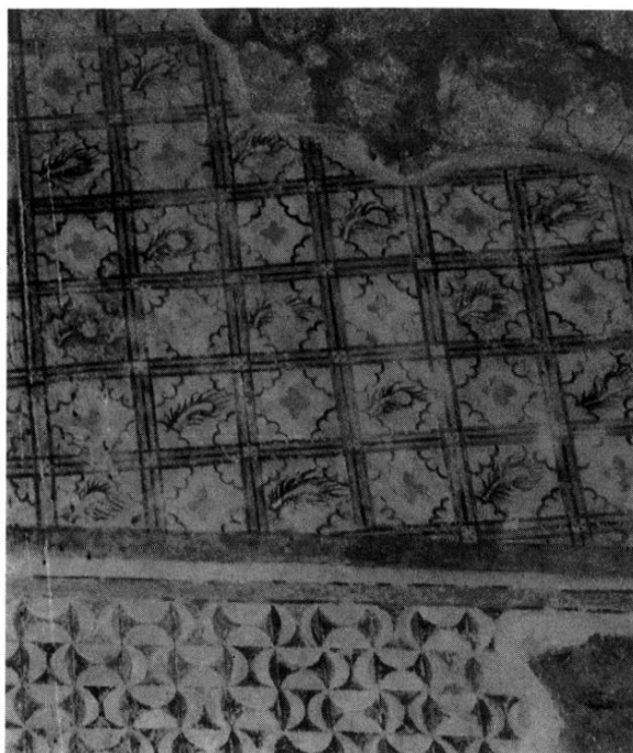
DAMIER AUX CROIX ROUGES DE LA DERNIÈRE TRAVÉE

(de grande taille et sous arcade trilobée) ; sainte Catherine est vue dans la scène de la controverse. Si la réalisation est peut-être contemporaine, au moins pour la campagne la plus ancienne (complétée au XIV e siècle par quelques personnages, dont Jean-Baptiste, Martial et Valérie), le style de ces tableaux indépendants liés par une riche grammaire décorative, qui a été comparé aux manuscrits anglais, est bien différent.