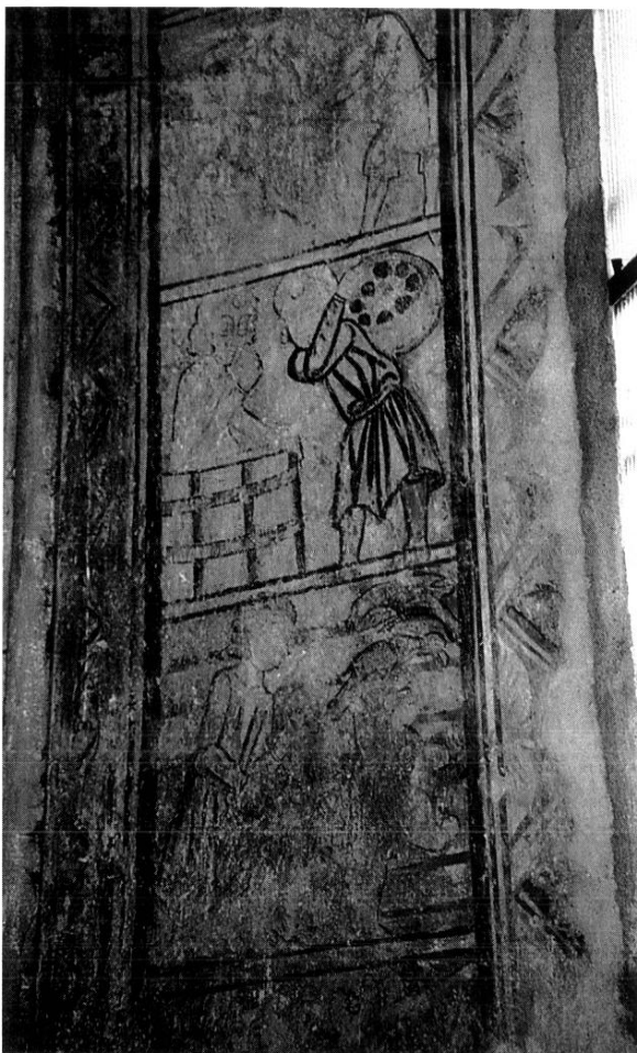
ÉBRASEMENT GAUCHE DE LA BAIE AXIALE : TRAVAUX DES MOIS

prépondérants, à l'inverse d'autres œuvres gothiques qui appellent le plus souvent des comparaisons avec les enluminures. La composition est sans génie, mais elle est aérée par les oppositions de couleur, qui permettent de retrouver un certain sens de la monumentalité. Les personnages, non dénués d'élégance, sont bien campés ; leurs gestes sont naturels. Quand les drapés sont bien conservés (périzonium du Christ, manteau de saint Jean, vêtements des prophètes de l'arbre de Jessé, tunique du spectateur foudroyé), les camaïeux de bleu ou pourpre soulignés de jaune leur donnent un vrai volume.