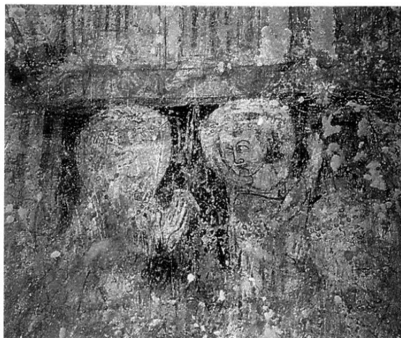
TRAVÉE 2, REGISTRE INFÉRIEUR : SAINTE ET SAINT COURONNÉS DÉSIGNANT SAINT JACQUES LE MAJEUR ?

Largement ouvert, mais aussi très abîmé, ce mur ne donne plus à voir que quelques vestiges peints. Des fragments fermement encadrés laissent supposer des représentations du