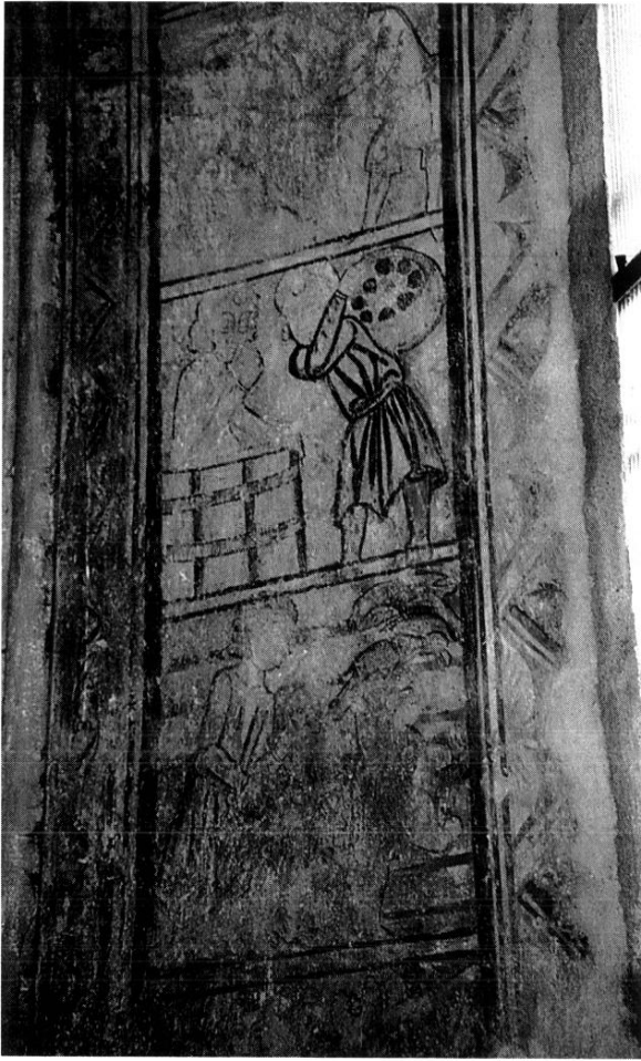
ÉBRASEMENT GAUCHE DE LA BAIE AXIALE : TRAVAUX DES MOIS

prépondérants, à l'inverse d'autres œuvres gothiques qui appellent le plus souvent des comparaisons avec les enluminures. La composition est sans génie, mais elle est aérée par les oppositions de couleur, qui permettent de retrouver un certain sens de la monumentalité. Les personnages, non dénués d'élégance, sont bien campés ; leurs gestes sont naturels. Quand les drapés sont bien conservés (périzonium du Christ, manteau de saint Jean, vêtements des prophètes de l'arbre de Jessé, tunique du spectateur foudroyé), les camaïeux de bleu ou pourpre soulignés de jaune leur donnent un vrai volume.