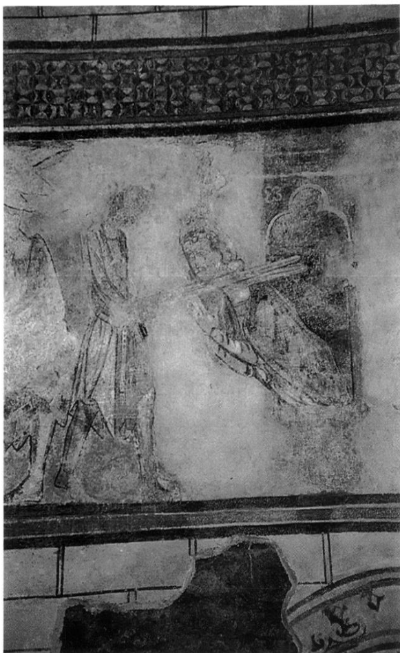
TRAVÉE 4 : MARTYRE DE SAINT JEAN-BAPTISTE ?

motif n'est pas inscrit au centre, mais s'échappe des ondulations.