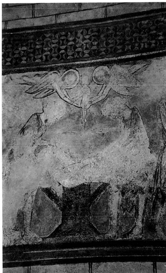
TRAVÉE 4 : MARTYRE DE SAINT SIMON : ?

* travée 5 : à l'intérieur du registre proprement dit, et hormis de petites arcatures qui pourraient ressembler à une base de sarcophage, à gauche, l'enduit ne subsiste que sous quelques silhouettes, dont l'une prostrée devant un évêque : évoquer sainte Valérie face à saint Martial serait tentant, mais imprudent en raison de l'état de conservation. Le plus intéressant ici est le damier supérieur, faux tissu plutôt que faux dallage, qui est de type véritablement gothique, aussi bien par sa valeur décorative que par sa signification héraldique. Les carrés, recoupés aux angles par des ondulations, présentent une alternance de croix rouges et de plumes (ou épis, ou palmes des martyrs ?). Si les croix sont évidemment l'emblème des templiers (donc antérieurement à 1307), il n'est pas sûr que les plumes, palmes ou épis aient une signification héraldique : le