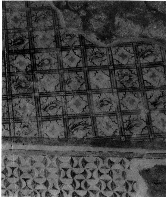
DAMIER AUX CROIX ROUGES DE LA DERNIÈRE TRAVÉE

(de grande taille et sous arcade trilobée) ; sainte Catherine est vue dans la scène de la controverse. Si la réalisation est peut-être contemporaine, au moins pour la campagne la plus ancienne (complétée au XIV e siècle par quelques personnages, dont Jean-Baptiste, Martial et Valérie), le style de ces tableaux indépendants liés par une riche grammaire décorative, qui a été comparé aux manuscrits anglais, est bien différent.