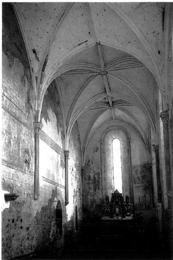
PAULHAC, VUE D'ENSEMBLE

la première travée n'a jamais été décorée que par des bandes de rinceaux ou motifs géométriques (y compris dans les verticales des pilastres d'angle, mais ici il n'y a encore que des sondages). Dans la deuxième travée (2), commence le grand registre historié : il est alors supporté par un registre inférieur qui disparaît ensuite. En revanche, dans la cinquième et dernière travée (5), le registre principal est surmonté et enrichi par un décor supplémentaire, d'un type exceptionnel : c'est un damier dont les lignes s'échappent en obliques vers le haut.