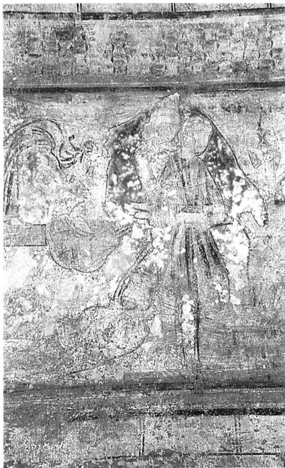
TRAVÉE 3, MARTYRE DE SAINT MARC ?

versent ; le deuxième porte une sorte de chaperon et s'appuie sur un bâton. Puis, à demi affaissé, un martyr (le premier des deux personnages précédents ?) est percé d'une lance qui lui traverse le dos, et décapité en même temps. Ensuite, le saint au chaperon subit lui-même une décollation, mais debout, de la part d'un soldat de haute taille habillé d'une cotte de maille sombre, très effacée ; entre les deux, un petit pèlerin agenouillé prie (il contribue sans doute à l'identification de saint Jacques le Majeur). La travée se termine par une lacune.