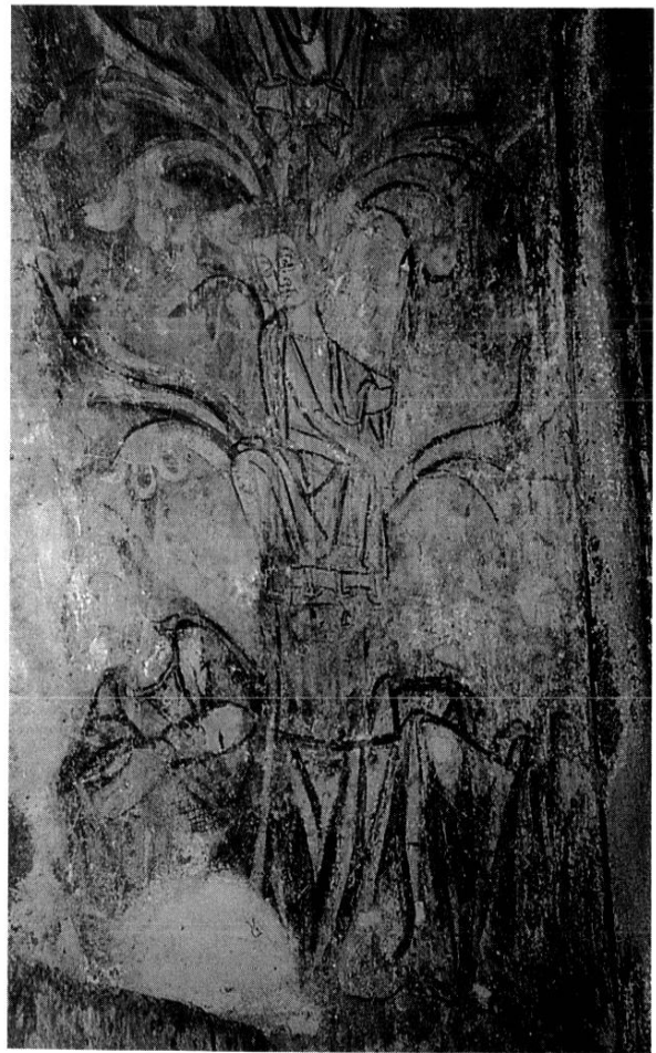
ÉBRASEMENT DROIT DE LA BAIE AXIALE : ARBRE DE JESSÉ

Le décor de La Croix-au-Bost est probablement légèrement antérieur à celui de Paulhac, et d'inspiration plus traditionnelle : on y trouve bien le même ruban large de peltes, mais il y est surmonté d'une guirlande de palmettes ; les croix de consécration doivent beaucoup à l'enluminure ; les inscriptions sont nombreuses ; les visages, triangulaires, sont plus allongés et plus