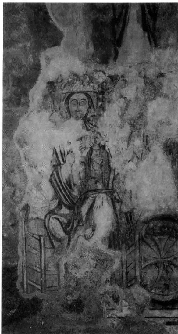
CHEVET : VIERGE À L'ENFANT (MOTIF SURIMPOSÉ À UNE CROIX DE CONSÉCRATION)

Cette dernière image, de grande taille, peut paraître étrange à cette place d'honneur, dans le chœur, mais elle montre bien la coïncidence entre la dévotion des templiers pour les martyrs