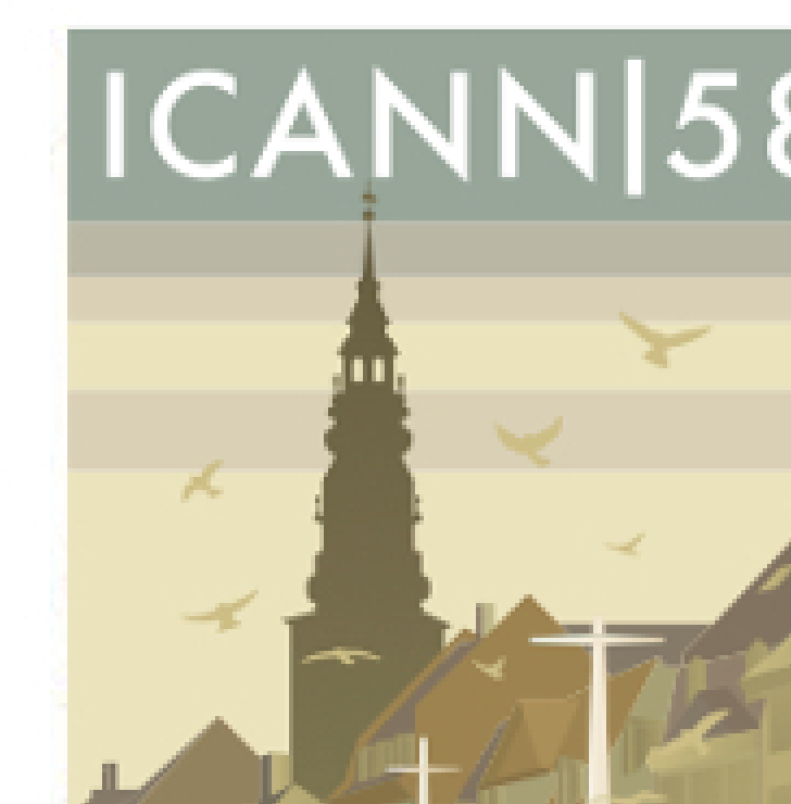
Participation à l'ICANN58 (Copenhague), ainsi qu'à l'ICANN62 (Panama city) afin d'intégrer les évolutions normatives du nommage sur Internet ainsi que les évolutions commerciales et technologiques.