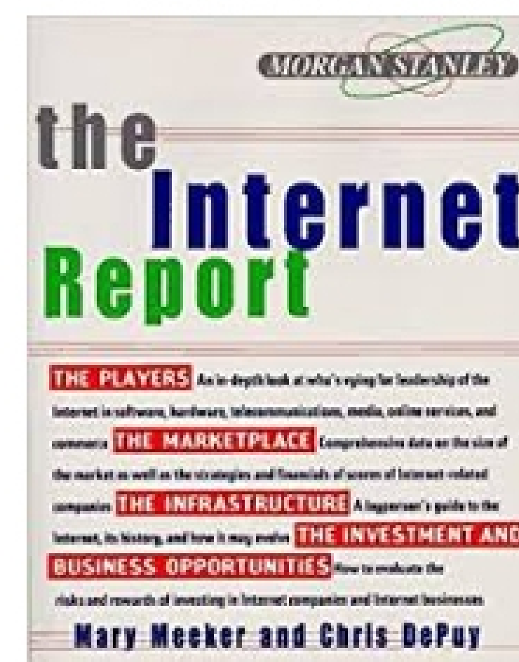
The Internet Report par Morgan Stanley est la première reconnaissance du potentiel d'Internet par le secteur économique.