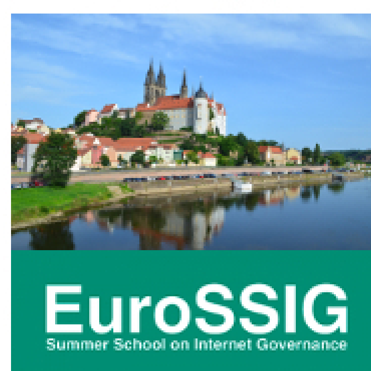
Aucune école en France ne dispense d'enseignement relatif à la gouvernance de l'Internet. Exemple de l'EuroSSIG.