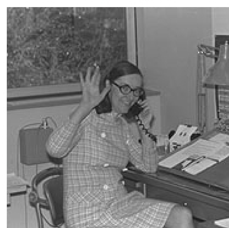
Création des gTLD, extensions génériques, par l'équipe dirigée par Elizabeth Feinler