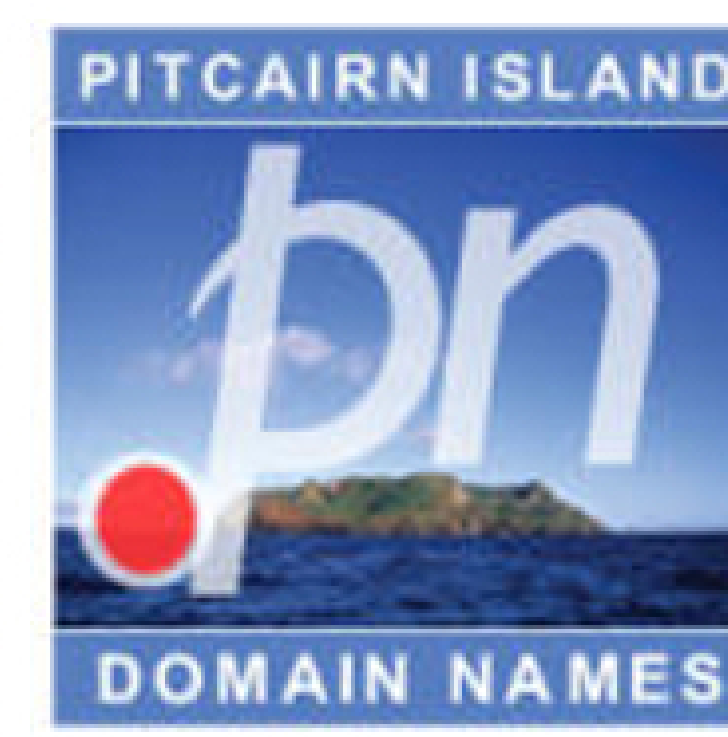
Création d'une économie pour certains territoires. Exemple de Pitcairn