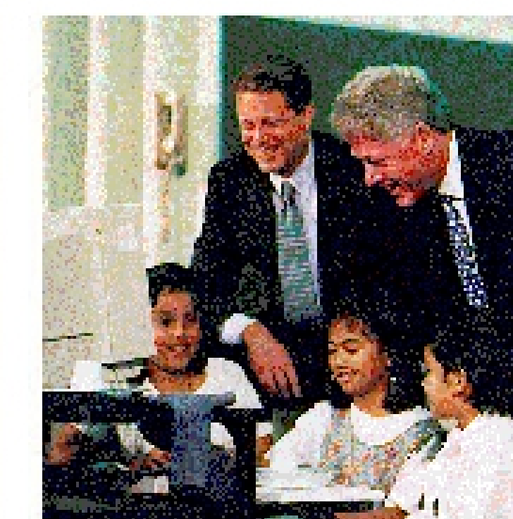
NetDay 1996 est la première initiative politique mondiale pour la démocratisation d'Internet. Le Président Clinton et le Vice-Président Al Gore s'engagent dans le développement des autoroutes de l'information, appellation d'Internet à l'époque.