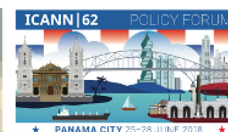
Participation à l'ICANN58 (Copenhague), ainsi qu'à l'ICANN62 (Panama city) afin d'intégrer les évolutions normatives du nommage sur Internet ainsi que les évolutions commerciales et technologiques.