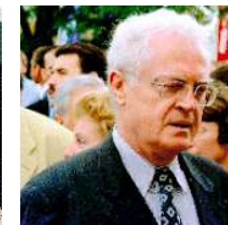
Le discours de Lionel Jospin en 1997 à Hourtin est la première initiative politique française pour encourager le développement d'Internet, à une époque où le Minitel est rentable pour la France.

Hypothèse 3: La gestion des noms de domaine est un levier de valorisation financière et extra-financière