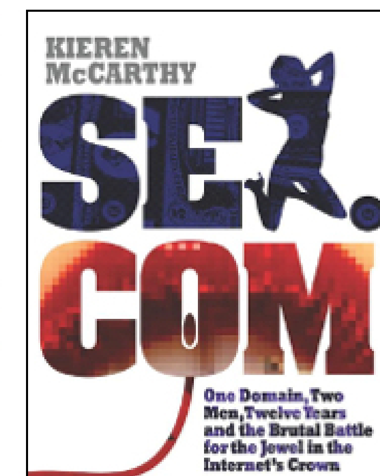
Création d'une économie pour les déposants, menant parfois à des histoires judiciaires. Exemple de SEX.COM

Hypothèse 2: Les impacts liés à la gestion des noms de domaine génèrent des risques et exigent des protections pour assurer sa pérennité