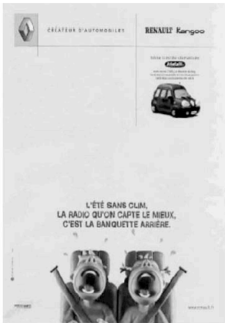
Figure 4. — L'été sans clim, la radio qu'on capte le mieux, c'est la banquette arrière.