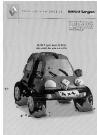
(b) « Le 4 × 4 que vous n'êtes pas prêt de voir en ville ».