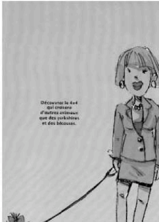
(a) « Découvrez le 4 × 4 qui croisera d'autres animaux que des yorkshires et des bécasses ».