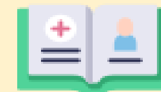
Illustration: cas clinique