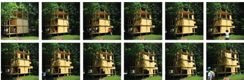
Référence de prototype réalisé à l'école d'architecture de Laval, Québec, proposant différentes configurations spatiales pour analyser et simuler les variations d'ambiances thermiques et lumineuses 9 . ECHASON permettra de simuler des situations d'écoute au moyen d'enceintes situées dans « l'échafaudage » ou à l'extérieur.

Depuis le démarrage de l'opération, Charlotte a pu assister aux différents ateliers entre la maîtrise d'œuvre et l'aménageur et présenter une première étude au regard des objectifs visés par ses recherches. Étant encore au début de son travail, elle a commencé par aborder son sujet comme un travail en agence, par l'étude du programme et des plans de l'ilot pour cibler les enjeux sonores, à savoir : le site dans sa configuration future, le lieu actuel dans ses configurations sensibles, les usages possibles, le protocole sonore pour anticiper les voisinages dans le projet participatif, les points de vigilance, les variantes possibles et les situations particulièrement intéressantes à modéliser. L'expérimentation a pour ambition de faire de l'écoute un paramètre indispensable à la conception écoresponsable de la ville, il ne s'agit pas uniquement d'éviter les erreurs de conception ou d'inconforts sonores mais bien de concevoir avec des intentions d'écoute.