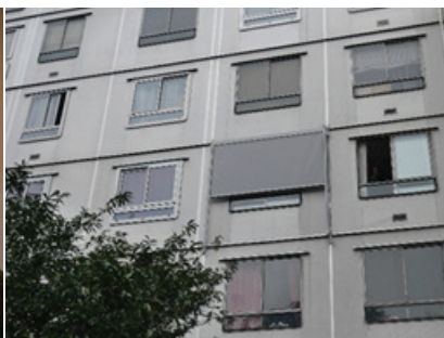
Le prototype de store posé sur la façade d'une habitante

À présent, le temps de la prise de recul est venu et une étude économique est en cours de réalisation dans le but de chiffrer le coût global de la réhabilitation pour les copropriétaires, le potentiel retour sur investissement, et la possibilité de transposition d'une telle démarche dans une activité de maîtrise d'œuvre qui aurait à se situer par rapport au système de production actuel.