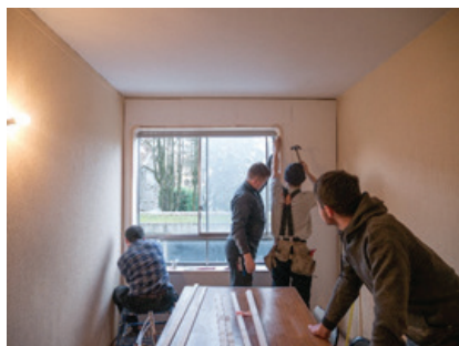
L'installation des prototypes par les Compagnons

Trois hypothèses de prototypage ont été évaluées au regard de leurs conséquences en termes de patrimoine, d'environnement, d'énergie et d'économie 7 . Un financement obtenu dans le cadre d'un appel d'offre du BRAUP 8 a permis d'engager la construction. Pouvoir expérimenter les solutions constructives imaginées en études et tester ses performances in situ est un atout considérable pour valoriser la recherche au sein de l'agence. Cela permet de les valider, écarter et optimiser. Installés dans l'immeuble par les Compagnons du Devoir de Villefontaine et les entreprises Asymptote (stores), KCM (Métallerie) et Fermacell, les prototypes ont pu être testés par les habitants qui ont particulièrement apprécié cette démarche.