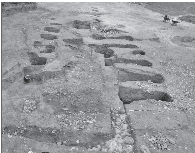
Fig. 3 – Vue en cours de fouille du bâtiment sur poteaux

présence, dans un des puits à l'ouest des mêmes types d'éléments architecturaux que ceux présents dans les tranchées (tommettes en opus spicatum sur mortier de tuileau, suspensurae , pilettes, quarts-de-rond, tubulures ou descentes d'eau, enduits peints sur mortier de tuileau). Ces éléments sont rarement attestés (notamment les tubulures) dans l'agglomération gauloise de Vieille-Toulouse et témoignent de la présence, si ce n'est au sein du bâtiment sur poteau, d'un édifice agrémenté d'un système élaboré de gestion de l'eau (chauffée ou non) à proximité de la fouille.