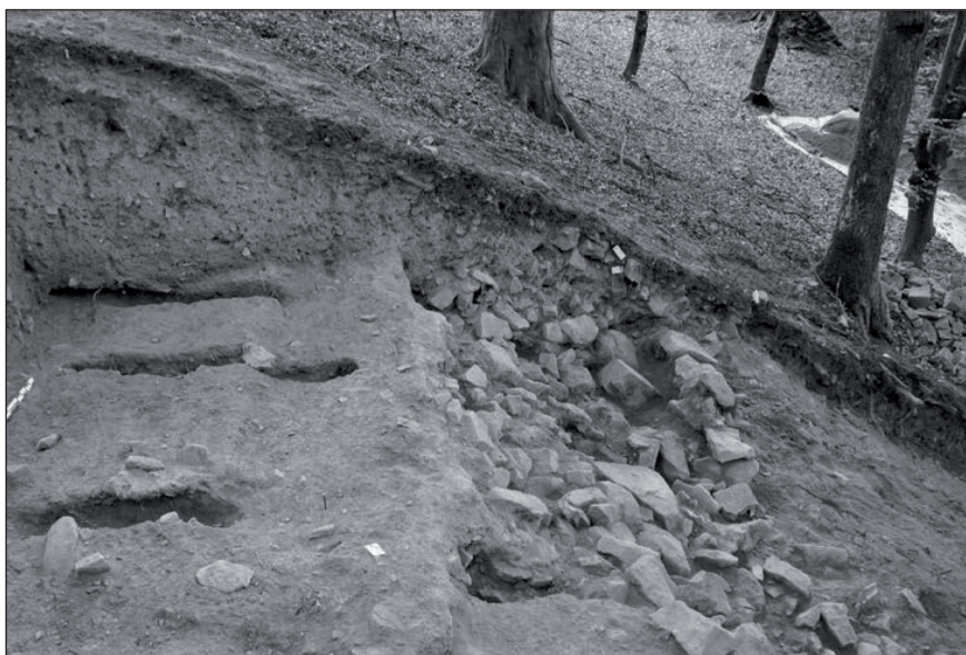
Fig.2 : Vue vers l'est du poutrage, du blocage et du parement du murus gallicus.