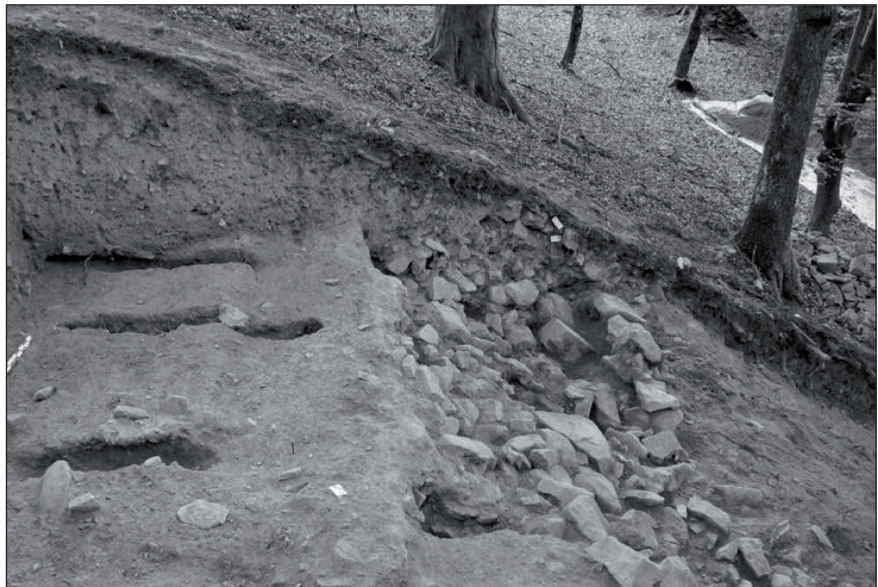
Fig.2 : Vue vers l'est du poutrage, du blocage et du parement du murus gallicus.