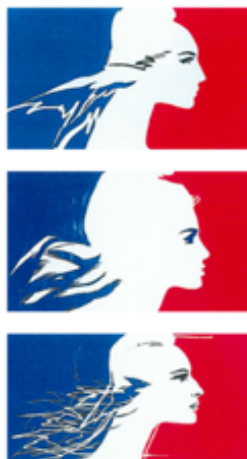
Figure 2 Les trois esquisses d'Isabelle Bauret. Reproduites par Guiard, 1999, 37.

En janvier 1999, le projet de signe étatique fut présenté au cabinet du Premier ministre, puis au Premier ministre, Lionel Jospin, qui le soumit lui-même au président de la République, en marge du Conseil des ministres du 27 janvier 1999. Ce dernier formula une réserve sur l'insertion du profil pour figurer la bande blanche verticale du drapeau, avant d'être convaincu dans la journée par une note du SIG mettant en série les identités visuelles des ministères usant du drapeau tricolore. S'excluant du périmètre, il précisa toutefois ne pas souhaiter que ce signe devienne aussi « son identifiant ». Les responsables de la communication des ministères furent ensuite consultés pour émettre un « avis technique », avant que le directeur de cabinet du Premier ministre ne présente le futur signe de l'État aux directeurs de cabinet des ministres pour un « avis politique ». Une fois l'approbation du visage-signé emportée, il restait encore à bâtir la charte graphique, codifier les usages, définir l'emplacement, prévoir l'architecture et l'endossement des autres éléments graphiques.