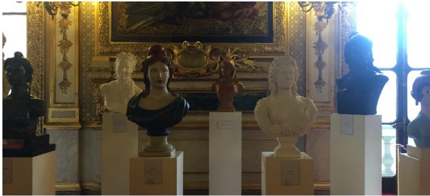
Figure 1 Exposition des bustes de Marianne conservés par le Sénat. Photographie personnelle, Palais du Luxembourg, février 2020.

Pour la Marianne de l'identité visuelle de l'État, à l'issue de la consultation de 1998, l'agence décida qu'elle serait représentée de profil, au centre d'un rectangle bleu, blanc et rouge. Il restait encore à savoir quels traits lui donner. L'agence mit en concurrence deux illustratrices. L'épreuve d'Isabelle Bauret, « une pro de l'univers féminin » (soit une dessinatrice de mode et de presse pour le magazine Marie-Claire ), a été sélectionnée à l'issue d'une étude qualitative — six réunions de groupe orchestrées par la société de sondages TNS SOFRES (figure 2). « J'avais dessiné des profils plus jetés, mais cela ne fonctionnait pas. Il ne s'agit pas ici d'un délire d'imaginaire, mais d'un profil très classique où chacun finalement peut projeter ce qu'il désire... », se souvient la dessinatrice (citée par Guiard, 1999, 38). Après quelques allers-retours avec le SIG, le profil jugé trop « poupée Barbie », puis « trop grec », fut proposé à des panels convoqués par l'institut de sondages. « Le projet d'identifiant unique pour l'État testé a tout pour être, non seulement accepté et apprécié, mais aussi accueilli avec joie : il sait véhiculer les valeurs recherchées, il suggère un État plus proche, sécurisant, plus humain et moins critiquable en le connotant d'une majesté et d'une puissance imaginaire renouvelées... », concluait l'étude (citée par Candiard, 2016, 39).