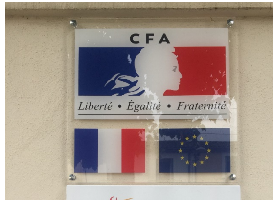
Figure 4 Plaque sur la façade d'un centre de formation. Photographie personnelle, Montpellier, mai 2020.

«Je ne me suis jamais dit qu'elle était bien appliquée cette Marianne, pour moi c'est toujours du merdique à la française. Je le prends comme cas dans mon cours sur les architectures de marque 20 » (figure 5), indique une professionnelle des marques et de l'identité visuelle, sidérée du manque de rigueur des administrations dans l'emploi d'un tel attribut de légitimité étatique. Caroline Ollivier-Yaniv explique la prolifération de ces pathologies à la fois par les difficultés pratiques à faire tenir des règles graphiques sur la durée, notamment avec la multiplication des interfaces numériques, et par la spécialisation de la communication institutionnelle (2019). Au fil de la professionnalisation de la communication des ministères, ces derniers ont gagné en autonomie et la «coordination procédurale se trouve aujourd'hui débordée et contrecarrée», obligeant les agents du SIG à se positionner plutôt comme «consultants internes au Gouvernement que comme contrôleurs des pratiques ministérielles» (2019, 674). En conséquence, même doté d'une police graphique et de puissantes catégories juridiques, le souci de vérité de l'énonciation étatique sur les objets peine à garantir les conditions de félicité de la fiction continuïste. Autrement dit, y compris en présence de frontières apparemment clairement tracées (l'État-gouvernement solidement arrimé au signe et la charte graphique), quelque chose échappe toujours.