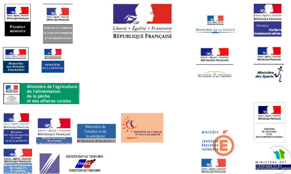
Figure 5 Constat de l'éparpillement du signe graphique, entre monolithe et pluralité des endossements. Support de cours, transmis par l'autrice, 2004.