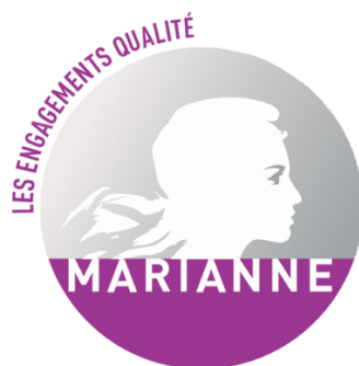
Figure 6 Logotype de la charte Marianne.

Réforme de l'État a amorcé de houleux échanges avec le SIG. Le visage blanc de Marianne avait été extrait du signe étatique et allait être affiché sous une forme recomposée dans les guichets des services publics (figure 6). Le SIG s'y opposa, en vain. Les responsables de la charte Marianne argumentèrent qu'il ne s'agissait ni d'un détournement ni d'un vol du signe étatique, mais encore et toujours de marquer la présence de l'État-gouvernement. À la différence près que l'État-gouvernement n'était pas l'auteur authentifié d'un document administratif — le signe diffère explicitement —, mais l'instance de contrôle et de validation de la qualité de l'activité administrative. La logique du sceau de l'État (entendu au sens constitutionnel du gouvernement) était selon eux pleinement conservée et le Premier ministre demanda au SIG de céder. On trouve cette même logique d'apposition d'un sceau de l'État (sans le recours à Marianne) dans d'autres domaines des politiques publiques, dont celui de la construction où l'État affirme sa présence sur le marché par l'apposition d'emblèmes et de signaux marchands que sont les labels de qualité (Mallard, 2021).