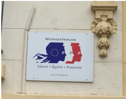
Figure 3 Plaque de la ville de Marseille sur la façade d'une école. Photographie personnelle, Marseille, novembre 2019.