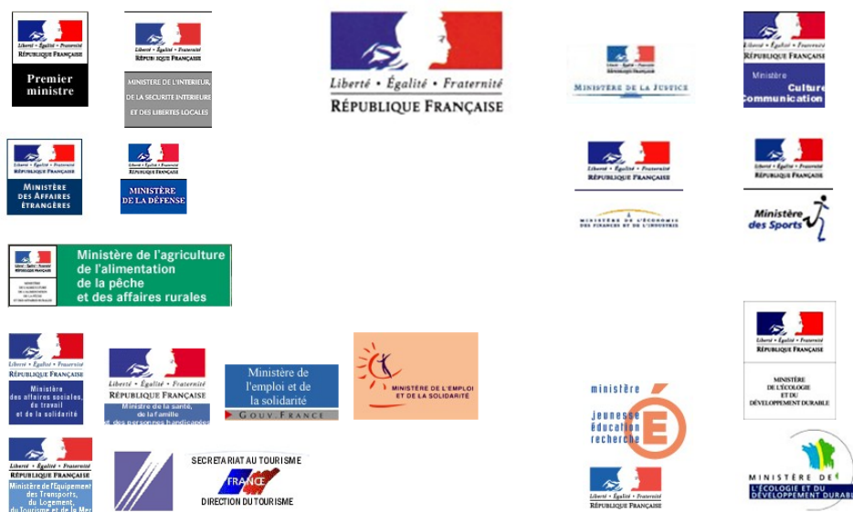
Figure 5 Constat de l'éparpillement du signe graphique, entre monolithe et pluralité des endossements. Support de cours, transmis par l'autrice, 2004.