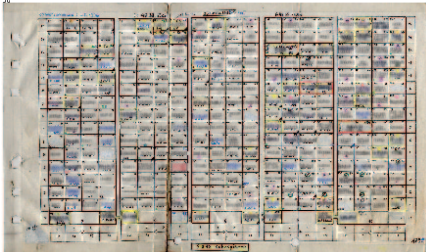
Présentation graphique de l'enquête effectuée dans la barre Robespierre en vue des travaux de réhabilitation, 1996 par Achour Rerzki.