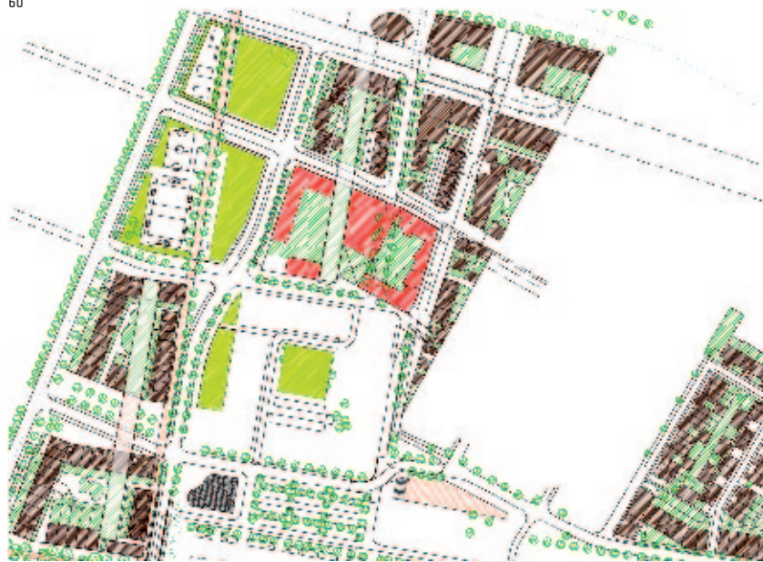
Paurd, Hamelin, Lvovsky, Projet pour le quartier des Clos (détail) avec empreintes au sol des barres Presov et Ravel qui traversent des îlots locatifs (brun) et un établissement scolaire (rouge), 2005.

(Hamelin, entretien, 2007) ou comme quelque chose qui "va faire un effet de mémoire" (Paurd, entretien, 2007).