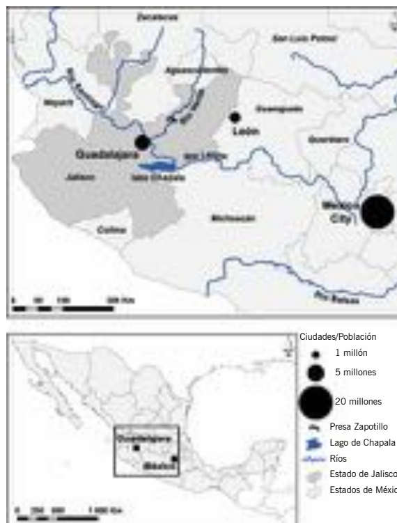
Los ríos en el Centro-occidente de México (elaboró: JP Cherel, UMR GRED 2015).

Desde 2006, se creó una coalición reducida pero eficiente para proteger los intereses de los futuros desplazados de Temacapulín. El aprendizaje adquirido durante las luchas precedentes explica el que la lucha haya permanecido hasta hoy, a pesar de la construcción de la presa. Así, se reconocen 4 grandes pilares necesarios para una coalición duradera: