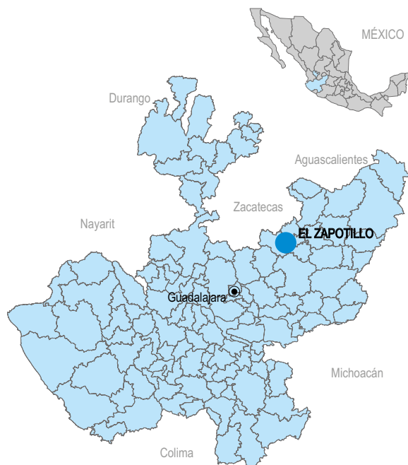
Conflicto 2 - La presa El Zapotillo.