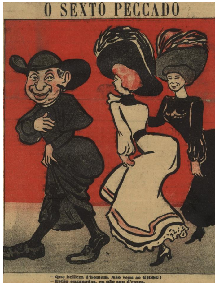
Imagem n.º 3: “O Sexto Peccado”. 41

Para acirrar a contenda, o editor Santos Vieira, escritor panfletário anticlerical, lança, sob o pseudónimo de Homem-Pessoa, uma sátira em versos fesceninos, O Bispo de Beja , 42 na qual expõe a suposta vida “depravada” e contranatura de D. Sebastião. O folheto é publicado clandestinamente pouco meses antes da Proclamação da República e reeditado logo a seguir. No seu opúsculo, o autor acusa o governo monárquico de encobrir o caso e escreve uma carta acusadora ao “Ministro da Justiça e Negócios e Sodomia Eclesiásticos”, numa subversão satírica das cartas enviadas pelo Bispo ao Ministro e Secretário de Estado dos Negócios Eclesiásticos nos anos 1908 e 1909, antes e depois do processo-crime que correu no Tribunal Eclesiástico da diocese de Beja, em novembro de 1909, contra o reverendo Manuel Ançã. 43