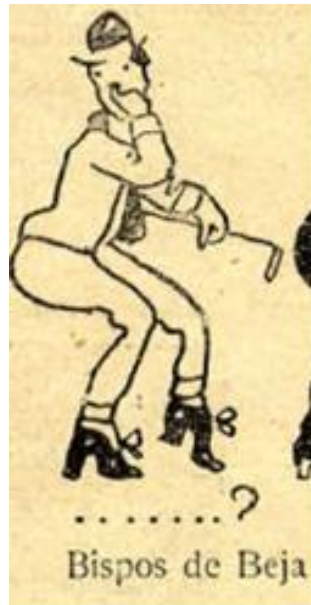
Imagem n.º 7: Caricatura de um homossexual. 62

Como se vê, o significante “homossexual” ainda não estava claramente estabilizado, e O Bispo de Beja tanto vai ajudar à sua estabilização no discurso social coevo quanto ao reacender da homofobia política nos primórdios da República, ao ponto do termo “Bispo de Beja” passar a designar, por algum tempo, os homossexuais (cf. imagem n.º 7).