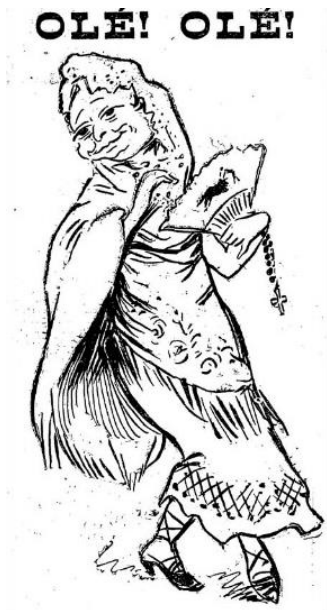
Imagem n.º 5: Caricatura: “Olé! Olé!”. 58

Logo a seguir à proclamação da República, o bispo refugia-se em Sevilha, a 5 de outubro de 1910, dando azo à imaginação anticlerical e homofóbica dos caricaturistas e jornalistas da imprensa humorística (cf. imagem n.º 5).