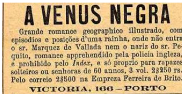
Imagem n.º 1: Publicidade a “A Vénus Negra” 19