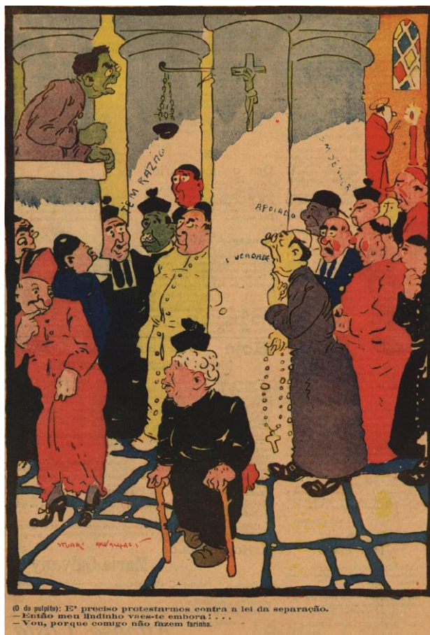
Imagem n.º 6: Caricatura “O Zé” 59

Além de se inscrever nessa luta política, a circulação de O Bispo de Beja não deixa de ser relevante para a história da homossexualidade em Portugal. Com efeito, participará da difusão dos termos “homossexual” e “homossexualidade” no discurso social português, como demonstra o artigo antologado do jornalista português Chacon Siciliani: 60