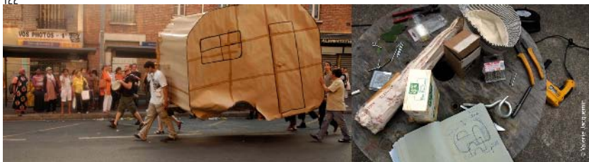
Performance, "Ceci n'est pas une caravane", réalisée par l'association Didattica dans le cadre d'un travail sur les représentations liées aux Roms. Exposition "Être rom(s) : entre stéréotypes et connaissances". Didattica, 2010, © Valérie Jacquemin

L'un des architectes interrogés évoque le fait qu'il travaille sur la représentation de l'espace qu'il appelle "espace symbolique". L'association Echelle inconnue a créé en 2002 le "brrb" – bureau de recherche et de réhabilitation des blasons – un "canular" médiatique proposant de transformer en matière synthétique les blasons de la ville de Rouen. Les nouveaux blasons sont conçus par des sans abri et symbolisent l'exclusion dont ils ont été victimes. À l'image des pratiques touristiques, des visites guidées ont été organisées et le local de l'association a été transformé en "bureau bis de l'office de tourisme". La médiatisation du projet et des réactions dans la presse ont fait de l'action artistique un événement public. Le projet est donc investi ici comme espace de débats sur la ville et ses représentations. D'autres collectifs vont également le penser comme espace "politique" voire comme "espace public" au sens philosophique (espace de l'assemblée citoyenne). L'illustration ci-contre montre un événement organisé par l'association Bruit du frigo dans