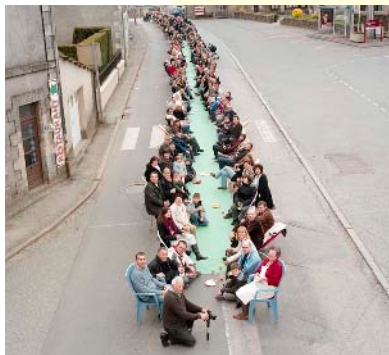
Banquet organisé par le Bruit du Frigo dans le cadre d'un "atelier d'urbanisme utopique" lié au projet urbain issu de la mise en place d'une déviation dans une petite commune des Deux-Sèvres. "1000 habitants pour une photo", Bruit du Frigo, 2006, © Kristof Guez.

L'un des architectes interrogés évoque le fait qu'il travaille sur la représentation de l'espace qu'il appelle "espace symbolique". L'association Echelle inconnue a créé en 2002 le "brrb" – bureau de recherche et de réhabilitation des blasons – un "canular" médiatique proposant de transformer en matière synthétique les blasons de la ville de Rouen. Les nouveaux blasons sont conçus par des sans abri et symbolisent l'exclusion dont ils ont été victimes. À l'image des pratiques touristiques, des visites guidées ont été organisées et le local de l'association a été transformé en "bureau bis de l'office de tourisme". La médiatisation du projet et des réactions dans la presse ont fait de l'action artistique un événement public. Le projet est donc investi ici comme espace de débats sur la ville et ses représentations. D'autres collectifs vont également le penser comme espace "politique" voire comme "espace public" au sens philosophique (espace de l'assemblée citoyenne). L'illustration ci-contre montre un événement organisé par l'association Bruit du frigo dans