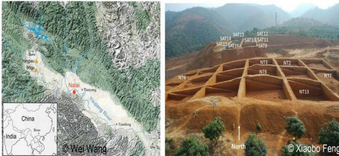
Localisation géographique des sites préhistoriques du bassin de Bose en Chine et vue générale du site de Nalai, dans la revue Journal of Human Evolution .

Les tectites sont des verres naturels contenant du potassium permettant la datation ^{40}\text{Ar}/^{39}\text{Ar} dérivée de la méthode K-Ar, formés par la fusion de la croûte continentale lors de l'impact d'une météorite. La composition des éléments majeurs des tectites, déterminée à l'Institut de Recherche sur les Archéomatériaux (IRAMAT), montre qu'elles appartiennent au groupe des tectites australasiennes dispersées dans les vastes régions de l'Asie, l'Australie et l'Antarctique, à la suite de l'impact d'une météorite situé en Indochine ou au sud du Laos, il y a 790 000 ans. A Nalai, l'outillage et les tectites proviennent des mêmes sédiments latérisés des niveaux supérieurs de la terrasse T4. Le site s'étend sur 30 000 m 2 , et plus de 3 000 outils et 300 tectites y ont été découverts. La datation par la méthode ^{40}\text{Ar}/^{39}\text{Ar} de quatre tectites découvertes en étroite association avec des bifaces et par conséquent contemporains, a été appliquée au laboratoire Géoazur (CNRS / OCA / IRD).