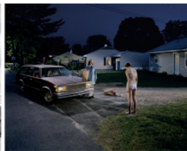
Pâté n°52 , 2001, photographie et © Catherine Harang ; Serris , 2000, photographie et © Jürgen Nefzger ; Untitled (Penitent Girl) , 2002, photographie et © Gregory Crewdson.