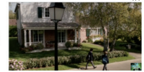
Dans la maison. Ajouts et mise en scène.

Une nouvelle fois, le film a été tourné dans deux maisons différentes : l'une a permis de réaliser les plans de la façade avant côté rue, et l'autre ceux de la façade arrière côté jardin. Les maisons qui ont été utilisées sont situées dans la ville de Mennecy (Essonne), au sein d'un lotissement bien particulier : très vaste, il comprend 1600 pavillons répartis sur 2km 2 de territoire, construits par la société américaine Levitt à partir de 1970. La maison qui a servi à réaliser la majorité des prises de vue côté rue, est une de ces maisons. La seconde, celle qui a fourni le décor pour les scènes côté jardin est située quelques rues plus loin 4 .