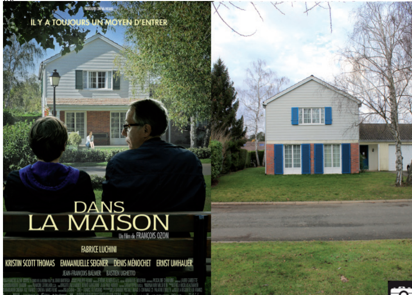
Dans la maison. Comparaison entre l’affiche du film et la maison utilisée pour le tournage

de perfection à l’américaine transposé dans une France qui ne possède pourtant pas l’équivalent exact de tels espaces. Cet exemple nous montre également la grande influence des séries et films américains non seulement sur notre manière d’appréhender l’espace, mais aussi sur celle qu’ont les réalisateurs de filmer un lieu. Il semble se développer une esthétique particulière, introduite par la représentation des “suburbs” à l’américaine dans des séries telles que Weeds , Desperate Housewives , Suburgatory , qui convoquent des couleurs, des procédés, des ambiances désormais propres à ce type de productions.