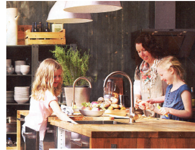
Catalogue Ikea 2011, "C'est ici que se concoctent les souvenirs d'enfance" (p.8-9) et "Histoires de votre vie"

2 En termes Ikea une ambiance est une pièce reconstituée au sein du magasin visant à mettre en avant un style d'aménagement et des solutions d'ameublement. Il s'agit de montrer les possibilités offertes par tel ou tel produit et les inscrire dans une logique combinatoire.