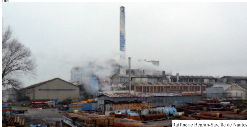
Raffinerie Beghin-Say, île de Nantes

Il s'agit maintenant d'imaginer une nouvelle approche du territoire, non plus basée sur une dramaturgie cinématographique linéaire, du début à la fin, mais sur le principe de visites à la fois géographiques et temporelles. Le visiteur-internaute partirait à la découverte du territoire de l'Île de Nantes à travers des itinéraires dans les différents quartiers mais aussi dans les différentes époques. À la manière de l'ange du film de Wim Wenders, il survolerait la ville et s'arrêterait pour écouter les récits d'hier et d'aujourd'hui et observer les mutations à l'œuvre. On peut imaginer que ces visites s'organisent autour de différentes thématiques : historiques et patrimoniales, urbanistiques et architecturales, ethnologiques et sociales. Elles seraient portées à la fois par la parole des habitants, le discours des "professionnels de la ville" et l'analyse de chercheurs : historiens, sociologues, spécialistes de l'urbain.