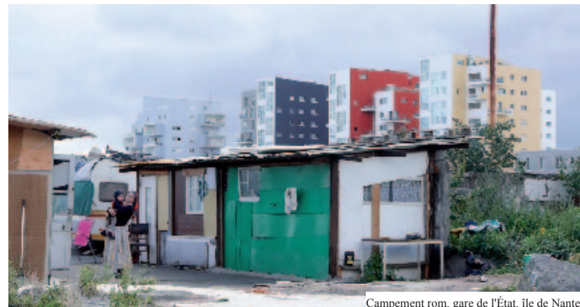
Campement rom, gare de l'État, île de Nantes

Il était là, debout, devant l'entrée d'un immeuble un peu miteux dont il occupait l'appartement du rez-de-chaussée et dont il avait tapissé les fenêtres d'articles découpés, reportages sur les tribus indiennes d'Amérique du Nord. L'incongruité m'avait surpris. Pendant plus d'une heure, il m'a raconté son histoire. À la cinquantaine, il avait