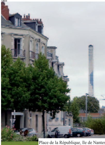
Place de la République, île de Nantes

appris qu'il était le fils d'un Indien Mohawk blessé lors du Débarquement. Le GI's avait fait la connaissance de sa mère, infirmière volontaire, lors de sa convalescence dans un hôpital militaire de campagne près de Savenay, entre Nantes et Saint-Nazaire. L'aventure ne s'était pas prolongée. Le Mohawk avait regagné les États-Unis en ignorant que, neuf mois plus tard, l'infirmière allait donner naissance à mon interlocuteur. Transformé par la tardive nouvelle de ses origines, l'homme consacrait désormais son temps à sa nouvelle identité en militant pour la cause des nations indiennes. Fin connaisseur de leurs différentes cultures, il était en contact régulier avec les Mohawks qu'il retrouvait régulièrement lors d'échanges transatlantiques. À y regarder de plus près, celui avec qui je devisais sur le trottoir gelé, fasciné par cette première rencontre insulaire, avait une vraie figure de native américain. Traversé par l'Histoire, la grande, ce Mohawk de l'île de Nantes l'avait été sans doute plus que