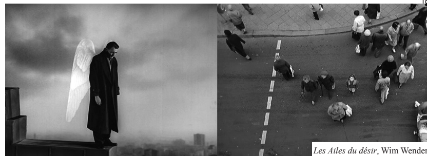
Les Ailes du désir, Wim Wenders

J'aimerais citer ici les magnifiques séquences du film de Wim Wenders, Les Ailes du désir (Der Himmel über Berlin, 1987) dans lesquelles l'ange Damiel, interprété par Bruno Ganz, survole la ville de Berlin percevant les pensées des habitants qu'il croise sur son passage, dans la rue, les appartements, les lieux publics. Aux préoccupations des uns répondent les joies des autres : jeune père arpenter le trottoir, cycliste au bord de la folie, adolescent en rupture familiale cloîtré dans sa chambre, homme visitant l'appartement de sa mère décédée, etc. Vision fantasmée d'un film total sur la ville autorisée par la fiction, ces séquences constituent pour moi une référence pour une représentation de la complexité urbaine, difficile à égaler dans une approche documentaire. Ce serait sans doute cela qui s'approcherait d'une vision idéale de la ville : une