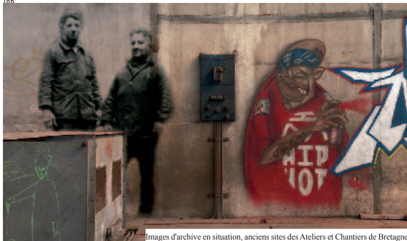
Images d'archive en situation, anciens sites des Ateliers et Chantiers de Bretagne