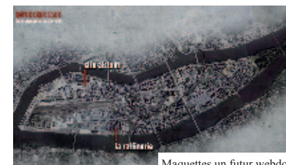
Maquettes un futur webdoc