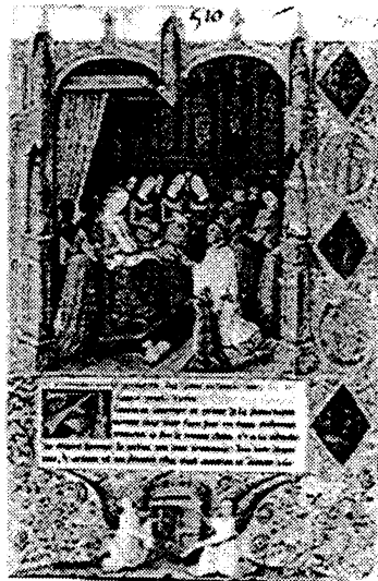
Fig. 2. L'hommage du livre à une reine de France, Marie d'Anjou ou Charlotte de Savoie. Pierre de Caillemesnil ou Robert Blondel, Les Douze périls d'enfer , Paris, BnF, Fr. 449, fol. 1.