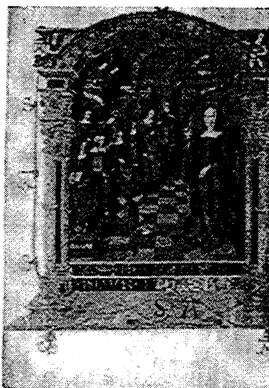
Fig. 6a. Anne de Bretagne et les sept Vertus. Guillaume Fillastre, Histoire de la Toison d'or (entre 1492 et 1498), Paris, BnF, Fr. 138, fol. 1v o .