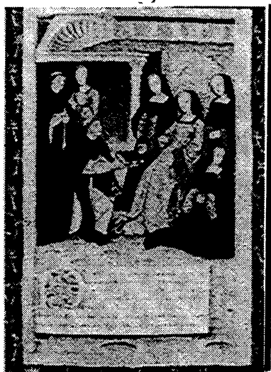
Fig. 5. Antoine Dufour remet le livre à Anne de Bretagne. Antoine Dufour, Vies des femmes célèbres (vers 1506), Nantes, Musée Dobrée, ms. XVII, fol. 1.