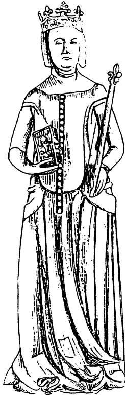
UNE REINE d'Occident