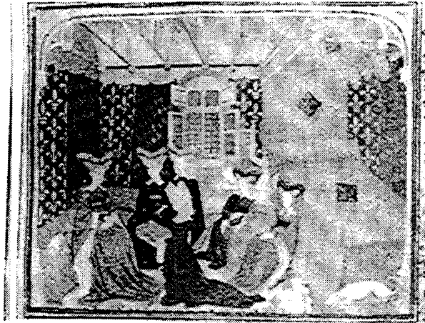
Fig. 1. Christine de Pizan offre son livre à Isabeau de Bavière. Christine de Pizan, L'Epistre d'Othea (vers 1410-1412), Londres, British Library, Harley 4431, fol. 3.