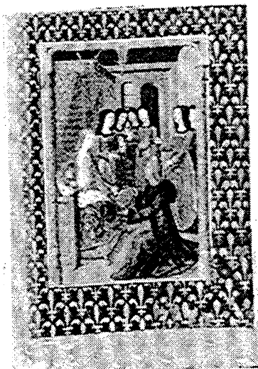
Fig. 3. Antoine Vérard offre son livre à Anne de Bretagne. Le Tresor de l'ame (vers 1497), Paris, BnF, Rés. Vélins 350, fol. aa6.