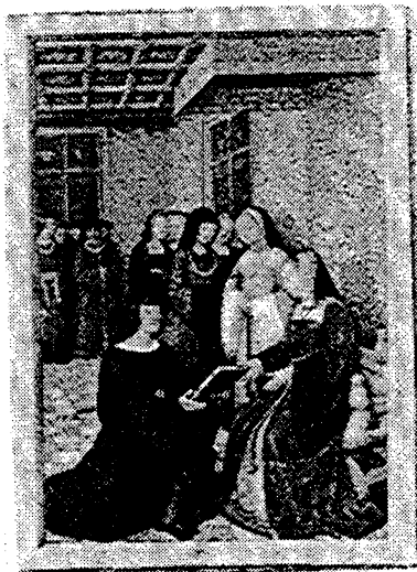
Fig. 4. Jean Marot offre son livre à Anne de Bretagne. Jean Marot, Le Voyage de Gênes (vers 1508), Paris, BnF, Fr. 5091, fol. 1.