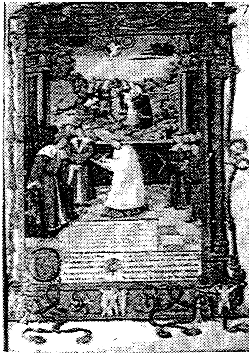
Fig. 6b. Guillaume Fillastre offre son livre à Charles le Téméraire. Guillaume Fillastre, Histoire de la Toison d'or (entre 1492 et 1498), Paris, BnF, Fr. 138, fol. 2.