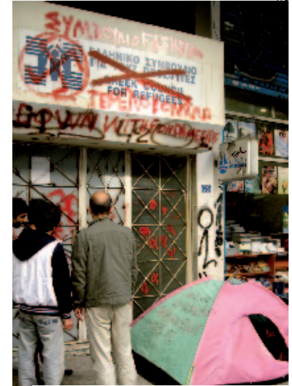
Bureau d'aide aux réfugiés – Aurélie Girard, mars 2011

En effet, la rapidité des changements de population est souvent perçue à Athènes comme une invasion, source de rejet par les Grecs. Le phénomène de l'immigration est caractérisé par la grande visibilité des migrants, souvent