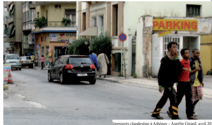
Immigrés clandestins à Athènes – Aurélie Girard, avril 2011

d'œuvre, notamment avec des pays méditerranéens. Les travailleurs – des hommes, notamment de nombreux Turcs – arrivent massivement en Allemagne, initialement pour travailler deux ans, mais s'installant finalement de manière pérenne. À partir de 1983, alors que la croissance économique s'apaise, une politique d'encouragement au retour des étrangers est mise en place. Mais celle-ci ne se concrétise pas comme prévu : de nombreuses familles se sont réunies sur le territoire allemand, donnant naissance à de nouvelles générations. Des lois font alors leur apparition à la fin du XX e siècle pour contrôler la situation des migrants (naturalisation, condition d'expulsion, jus soli ). Lors de la dislocation de l'URSS, de nombreuses personnes immigrèrent à nouveau à Berlin : ce sont les Spätaussiedler : allemands de souches ayant longtemps vécu dans le bloc soviétique et qui reviennent sur le sol allemand. Depuis la chute du Mur, et encore fortement aujourd'hui, "Berlin, ville ouverte et tolérante", est le symbole que ses habitants et ses politiques cherchent à exposer au Monde. Revers naturel d'une histoire tourmen-