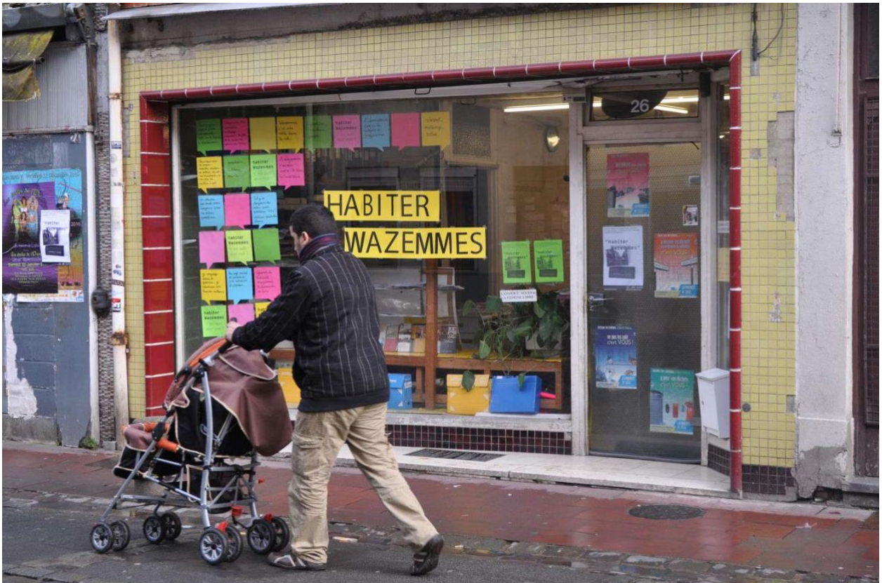
Fig.2: vitrine du local de travail où s'est installé l'équipe de la 27e Région. (nom du fichier: Residence_Wazemmes_selection_1)

La première semaine a servi à prendre le pouls du quartier. Installée dans un local, l'équipe a mis en place une vitrine participative afin de demander aux passants ce que signifiait, pour eux, habiter Wazemmes (fig.2). Cette vitrine agissait comme une première amorce en poussant les habitants à prendre un premier recul sur leur propre environnement. C'est aussi pour l'équipe une façon de se présenter et de préparer le terrain à l'exposition.