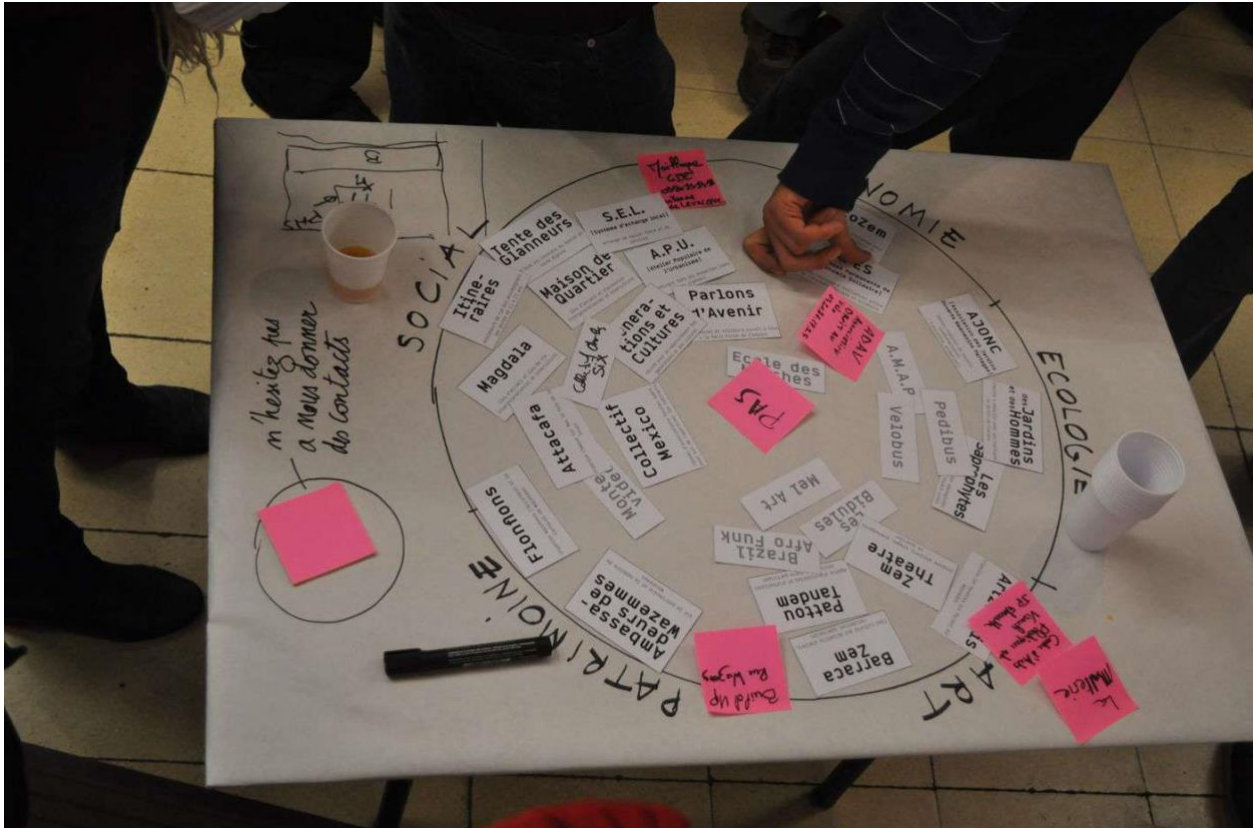
Fig. 5 : cartographie des problématiques locales du quartier. (nom du fichier : Residence_Wazemmes_selection_6)

Certains de ces objets frontières, comme une cartographie des problématiques locales (Fig.5), invitaient les participants à la manipuler, à la spatialiser et l'organiser de différentes manières, en somme à créer une conversation entre eux et le projet. À travers la manipulation, le filtrage et l'organisation de ces documents, les participants les spatialisaient, réarrangeaient, plaçant des éléments l'un à côté de l'autre, juxtaposant, etc.