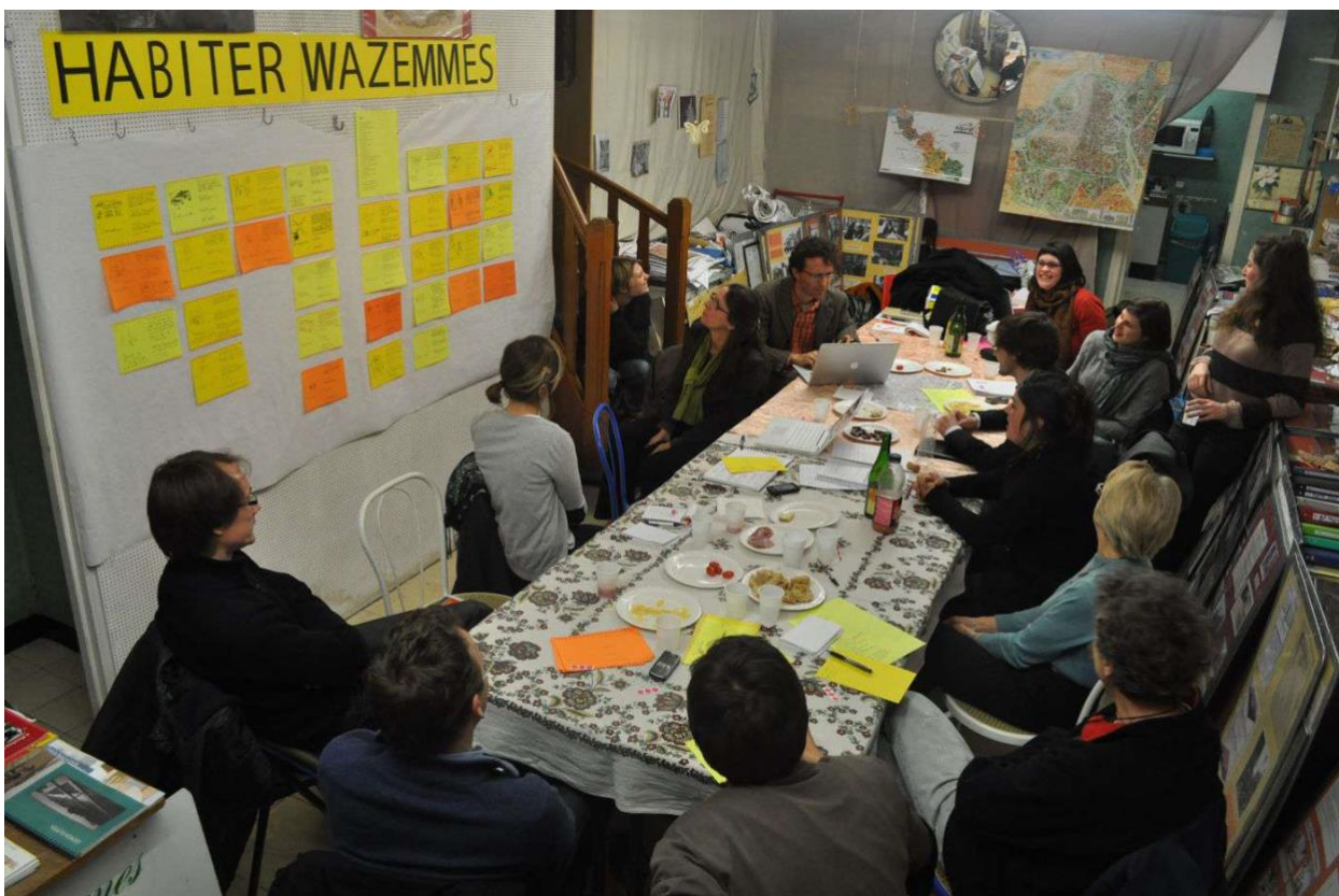
Fig.6 : local de l'équipe de la 27e Région. (nom du fichier : Residence_Wazemmes_selection_9)

Tout se fait donc dans l'action. Les activités successives et la place laissée aux publics permet, petit à petit, de construire/d'activer collectivement un point de vue, une réflexion sur le design, ici appliquée à la question de l'habitat, l'habitabilité ou la participation/construction citoyenne et le design. L'enjeu ici est bien de provoquer la pensée plutôt que de seulement la représenter à travers un ensemble de documents. Le document est là pour activer et saisir des rapports critiques aux objets vécus et permettre aux publics de prendre de la distance par rapport à ces objets (le quartier). L'exposition ne correspond donc pas seulement à un thème général qu'il faudrait expliquer à travers des objets. Le thème est un point de départ pour une pratique réflexive du thème en lui-même réinvesti par les habitants (il ne s'agit donc pas de susciter un usage mais une discussion sur l'usage).