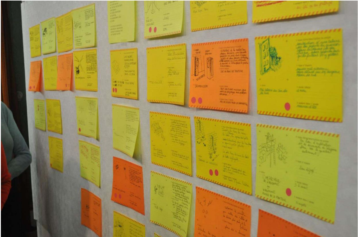
Fig 4. : Fiches-projets permettant aux habitants d'exprimer des idées pour le quartier et d'en débattre. (nom du fichier : Residence_Wazemmes_selection_8 )

Par la suite, des explorations du quartier furent organisées avec des wazemmoises afin d'identifier des espaces que les habitants auraient envie d'investir. Les participants ont ainsi pu coller des autocollants dans les espaces choisis et noter dessus ce qu'ils souhaiteraient y faire tout en laissant des autocollants vierges pour de futurs passants. Ce repérage permettait, durant l'exploration, d'amener des discussions sur la manière dont ces idées pourraient devenir réalité.