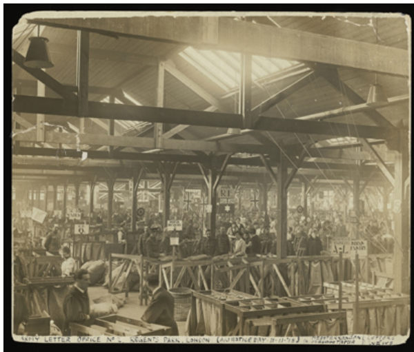
L'Army Postal Service britannique traite pendant la guerre plus de deux milliards de lettres et 114 millions de colis en provenance ou à destination des troupes sur le front occidental. Photographie du Home Depot, Army Letter Office n°2, Londres (Regents Parks), 11 novembre 1918.