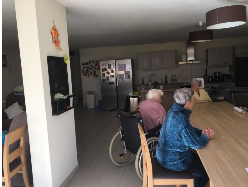
Planche 2 : l'aménagement intérieur des espaces communs

« Moi je me suis toujours sentie à l'aise au sens où vous rentrez dans la maison. [...] Vous pouvez aller vous servir un café si vous voulez vous servir un café, il y a toujours la cafetière, la théière. Si vous venez avec des personnes et que vous voulez faire un petit quatre heures, il y a aucun souci. On vous dit bien : "c'est votre cuisine, c'est votre maison". Vous voyez, il y a pas de gêne... ça fait assez coloc étudiant quelque part. »