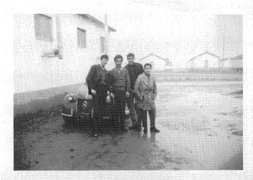
Camp de Harkis à Rivesaltes (Pyrénées-Orientales) - 1962