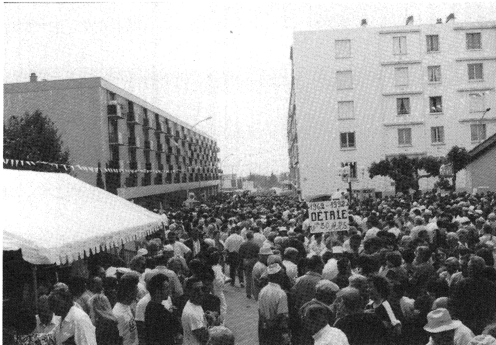
Pèlerinage de Santa Cruz - Nîmes (Gard) - mai 1992