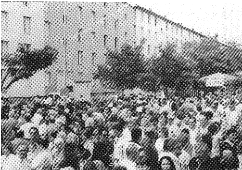
Pèlerinage de Santa Cruz - Nîmes (Gard) - mai 1992