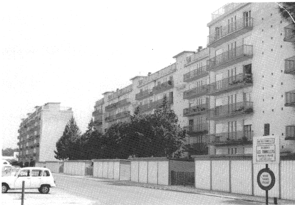
Cité de Rapatriés à Montpellier - mai 1992