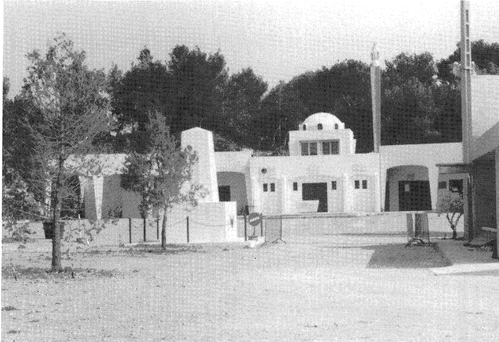
Sanctuaire de Santa Cruz à Nîmes (Gard) - mai 1992