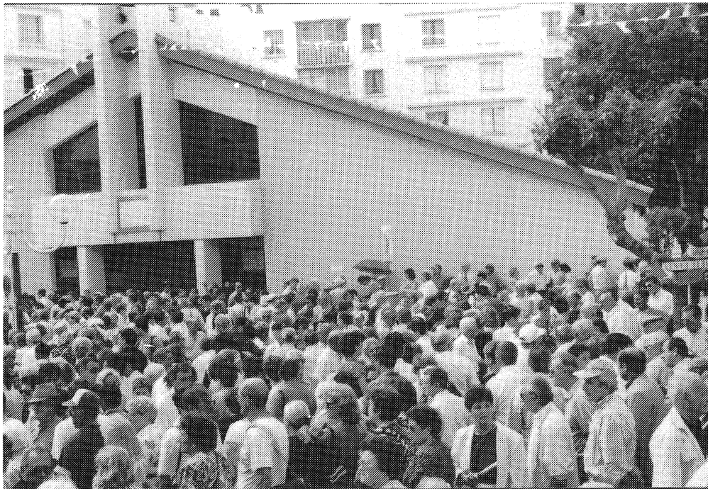
Pèlerinage de Santa Cruz - Nîmes (Gard) - mai 1992