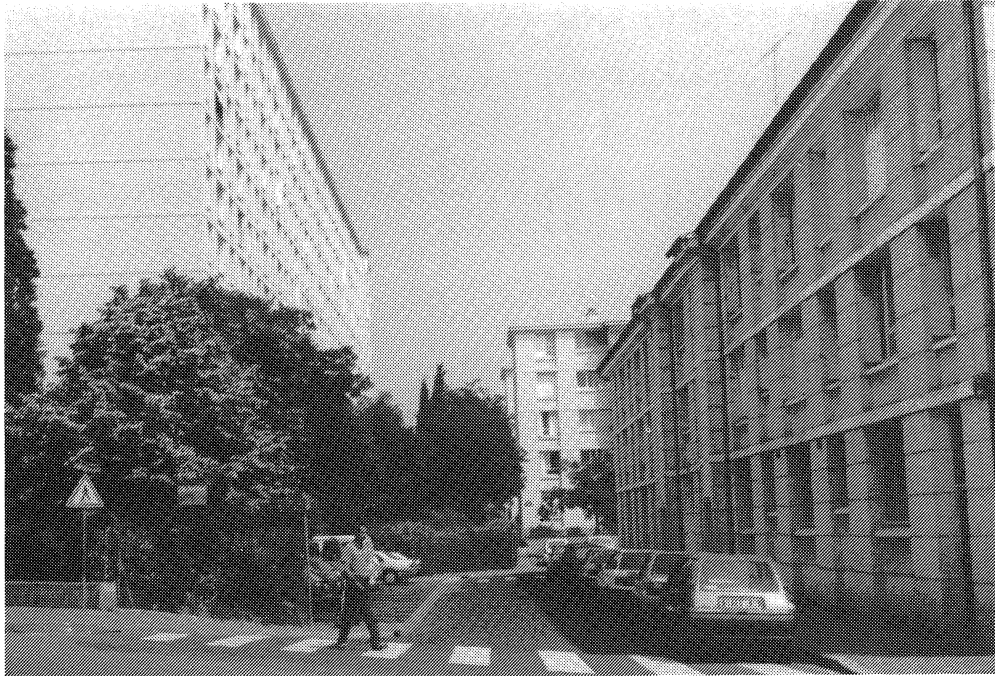
Cité de Rapatriés à Montpellier - mai 1992