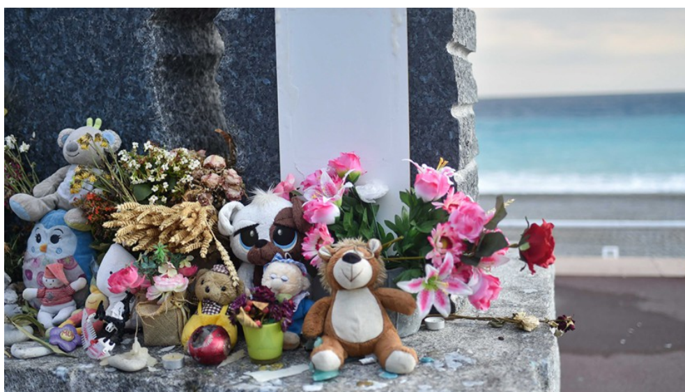
3. Hommages aux enfants victimes de l'attentat du 14 juillet, déposés sur la stèle dédiée aux Français d'Algérie (Karine Emsellem, 27 juillet 2016)

Lieu de plaisir, la Prom' est aussi marquée par la mort. Cette dernière y est inscrite depuis longtemps, par des lieux de célébration et de mémoire qui rythment cette longue courbe, voire l'encadrent. D'un bout à l'autre, on trouve ainsi : à l'est, vers Rauba Capeu, l'immense monument aux morts de la Première Guerre Mondiale, puis la stèle dédiée aux Français d'Algérie et aux Harkis qui symbolise la « déchirure entre les peuples ». À l'ouest, à Carras, une autre stèle rend hommage