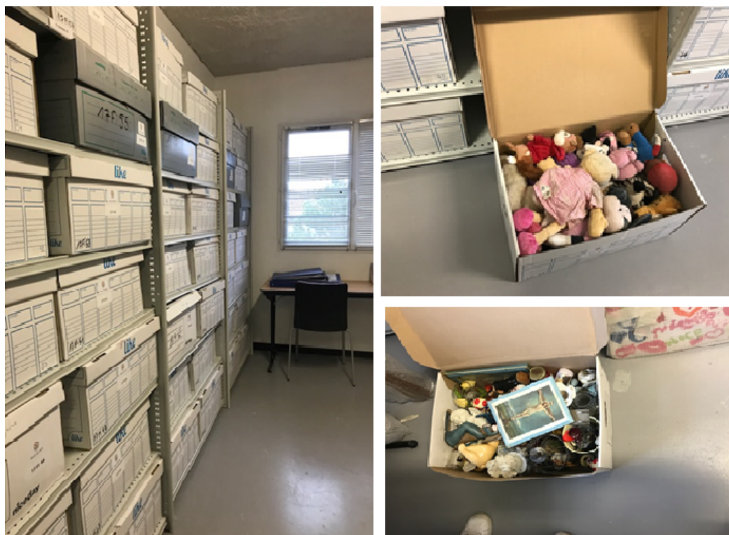
7. La salle d'archives « 14 juillet 2016 ». 65 mètres de linéaires avec des boîtes de peluches comme neuves et de « brocante ». (Karine Emsellem, Novembre 2018)