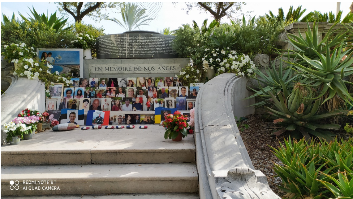
8. Le mémorial officiel temporaire aux victimes de l'attentat du 14 juillet 2016. (Agnès Jeanjean, janvier 2020)