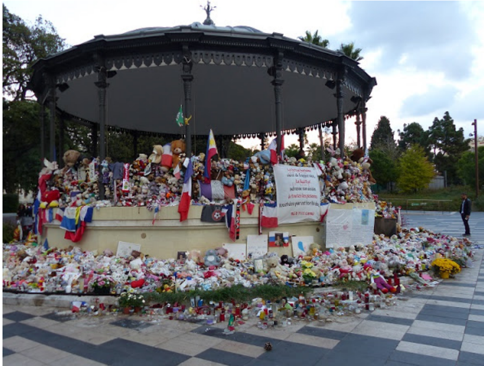
6. Le kiosque à musique, mémorial éphémère (Karine Emsellem, octobre 2016)

et les trottoirs adjacents, puis regroupés le 18 juillet sous un kiosque à musique proche, et ce durant 6 mois au terme desquels ils ont été transférés aux archives. Ces déplacements sont traversés de tensions – comme le souligne le titre d’un article publié par la directrice des archives : « archives sous tension » 8 (Duvigneau, 2018). Ils relèvent de dynamiques spatiales entre perte, conservation et production.