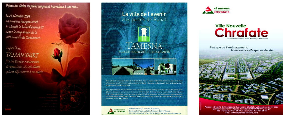
Figure 3 Une mise en image appuyée des projets marocains de villes nouvelles : exemples d'affiches