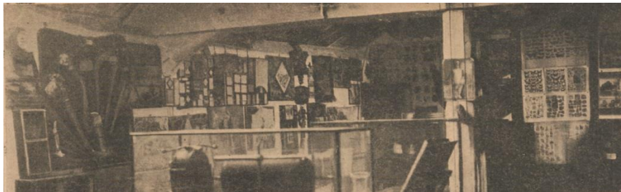
Auguste Marie, « Le musée d'asile ». (Marie, 1910 : 42)

Tout comme son confrère écossais, Marie prône l'application d'un traitement moral de la folie : « [...] un des meilleurs moyens d'adoucir une captivité souvent indispensable, est d'encourager les malades dans leurs dispositions