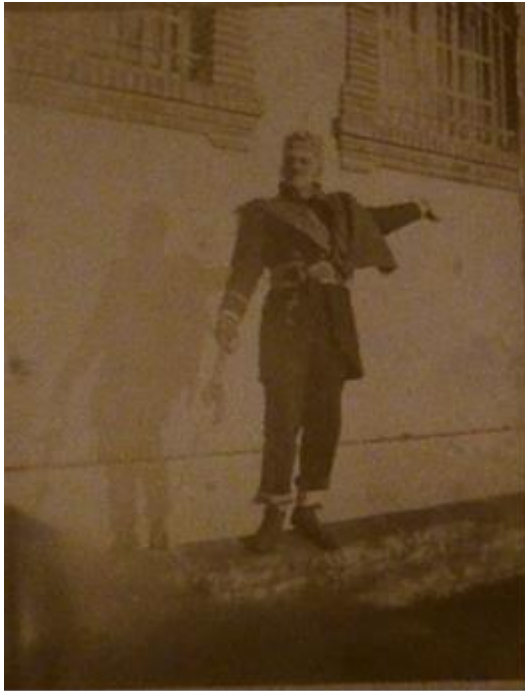
Fernand d'Alquier en Cyrano, photographie noir et blanc, vers 1910

clinique, des psychiatres vont dès le début du XX e siècle s'intéresser de plus près à ces auteurs marginaux.