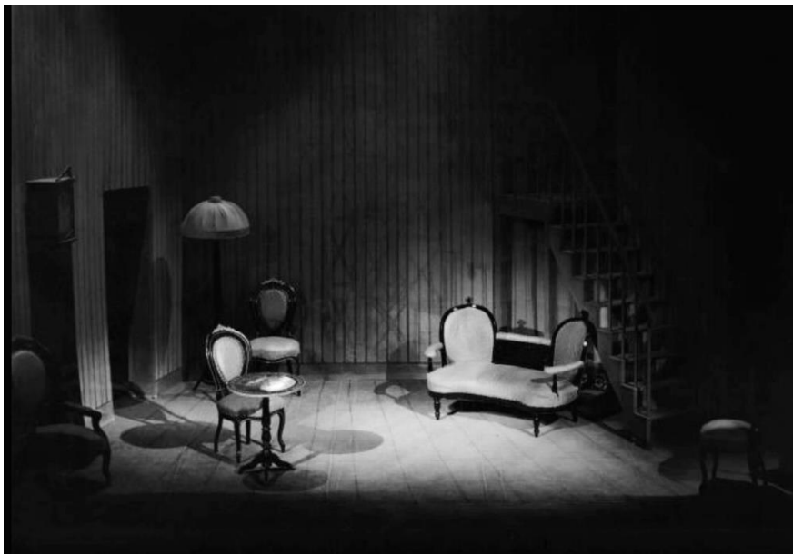
3. Le notti dell'ira (Les nuits de la colère) , d'Armand Salacrou, photographie du dispositif scénique, © Archivio Piccolo Teatro di Milano – Teatro d'Europa.