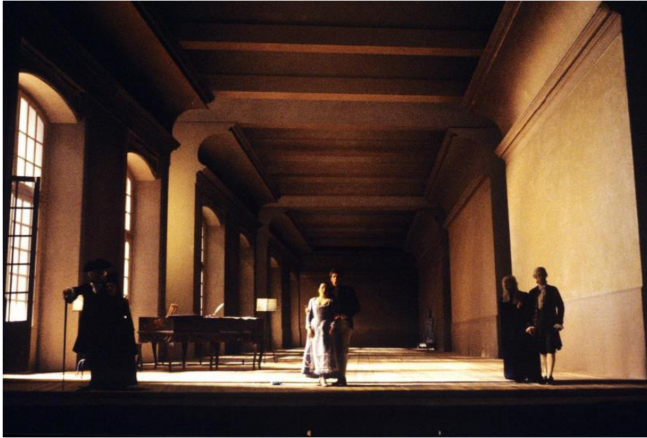
10. Le Nozze di Figaro , de W. A. Mozart, acte III, 1981, photographie de Lelli e Masotti © Teatro alla Scala.

Encore une fois, Strehler s'empare de cette scénographie de Frigerio en lui imposant ses lumières. Il intervient sur l'effet de perspective créé par les éléments construits en dur — le sol, les parois, le plafond — en rajoutant une trame, immatérielle, de lignes claires et obscures. Le sens d'une progression résulte se trouve ainsi amplifié. Dans un lieu clôturé et relativement limité, une fois de plus la lumière contribue à alimenter l'illusion d'un espace grand, non seulement profond mais s'étalant aussi en largeur, au-delà des fenêtres.