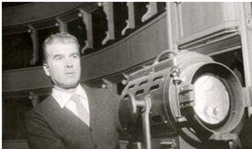
13. Giorgio Strehler, © Archivio Piccolo Teatro di Milano – Teatro d'Europa.

Cherchant les réponses à ces questions, nous sommes tombés sur cette photo de Strehler derrière un projecteur qui semble concentré à faire des réglages techniques.