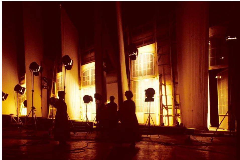
12. Le Nozze di Figaro , de W. A. Mozart, 1981, installation des éclairages, photographie de Lelli e Masotti © Teatro alla Scala.

Cinq années après la création des Noces de Figaro à l'opéra, Strehler est invité à mettre en scène la Trilogie de la villégiature de Goldoni, au Théâtre de l'Odéon, avec les interprètes de la Comédie Française. Cette pièce traite de la