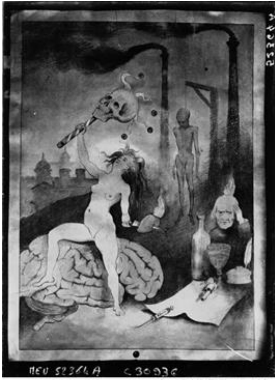
Agence Meurisse, Œuvre de fou , galerie Vavin, Paris, 1927. © Gallica.

Plus que des objets, certaines productions exposées sont hissées au rang d'œuvre d'art, comme en témoignent ces lignes de Roger Dardenne : « Les peintres d'asiles ont toutes les audaces. D'aucuns feraient figure aux manifestations d'avant-garde. Il en est qui invente des pays de rêve où la flore et la faune se mêle étrangement. Ainsi on peut trouver ici certaines de ces expressions qui prétendent ailleurs être l'art de demain et même l'art tout court » (Dardenne, 1929 : 6).