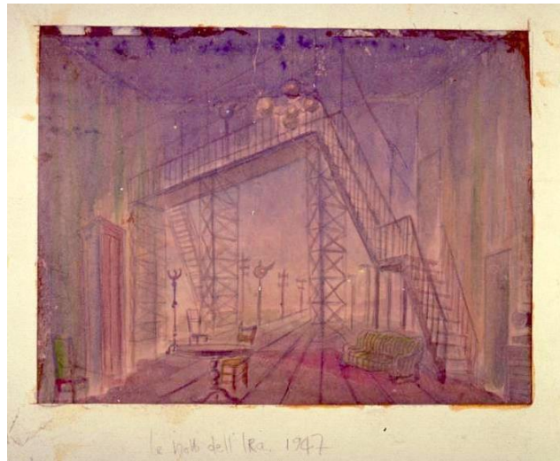
2. Croquis de Gianni Ratto pour Le notti dell'ira ( Les nuits de la colère ), d'Armand Salacrou, © Archivio Piccolo Teatro di Milano - Teatro d'Europa.

Ils nous montrent la solution adoptée pour la mise en scène de Strehler : un espace d'intérieur — et plus précisément un salon — capable de se transformer en un extérieur où le pont des chemins de fer — avec sa structure métallique — envahit la scène entière. La transition d'un espace dramatique à l'autre repose entièrement sur les éclairages :