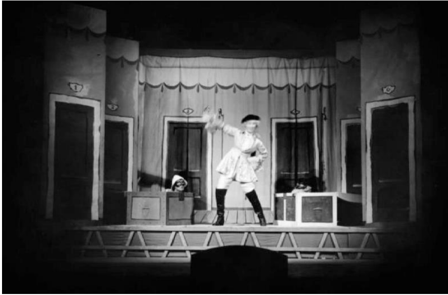
6. Arlecchino servitore di due padroni , de Carlo Goldoni, 1947, © Archivio Piccolo Teatro di Milano – Teatro d'Europa.

Au fil des années, plusieurs variations de ce spectacle sont réalisées 6 . Déjà vers la moitié des années 1950, un nouveau scénographe, Ezio Frigerio, propose une scène où les éléments de la version précédente, le tréteau éphémère, l'intérieur de l'auberge en toile peinte, sont encadrés par des éléments architecturaux. Ce sont des ruines, de restes de murailles nous suggérant que l'espace ne représente plus seulement un intérieur mais aussi, et en même temps, un extérieur. Dans cette version les éclairages électriques, car il faut bien imaginer que cette scénographie était conçue pour le théâtre fermé, doivent rendre compte à la fois du plein air, et de l'auberge.