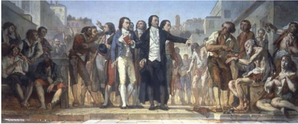
Charles-Louis Müller, Pinel fait enlever les fers aux aliénés de Bicêtre , huile sur toile, 1848, hall de réception. © Ecole nationale de médecine, Paris.

maladies mentales, allant de pair avec une reconsidération plus humaine du sujet. Le traitement moral de la folie, instauré au XVIII e siècle par Philippe Pinel (1745-1826, aliéniste français connu comme étant le Père de la psychiatrie en France) ainsi que d'autres praticiens, fait rupture avec la politique dite du « Grand renfermement » 2 , élaborée au XVI e siècle, et à la suite de laquelle on enfermait dans un même lieu, mendiants, fous, pauvres et criminels.