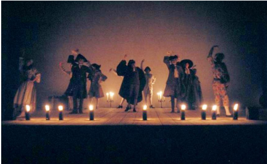
9. Arlecchino servitore di due padroni , de Carlo Goldoni, 1987, photographie de Luigi Ciminaghi © Archivio Piccolo Teatro di Milano – Teatro d'Europa.

Un soir, dans un théâtre du monde, nous avons terminé cette comédie de la joie, nous l'avons terminée en larmes et jamais, je pense que jamais, tous ceux qui étaient présents ce soir-là n'ont ressenti plus profondément la gloire du théâtre, sa splendeur contre tout et contre tous, dans l'obscurité de la nuit des hommes ( Archivio Piccolo Teatro , 1987 : "Arlecchino servitore di due padroni").