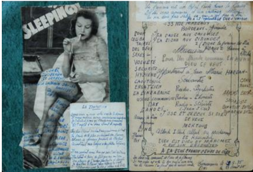
Anonyme, cahier de collage et de poésie, encre, vers 1920, Collection du D r Pailhas.

Illustration de l'art asilaire qui tend à s'affirmer dans le courant du XX e siècle, la collection Pailhas nous permet d'observer l'augmentation de l'intérêt du docteur pour les productions de ses patients et leur constitution en ensembles dès le XIX e siècle.