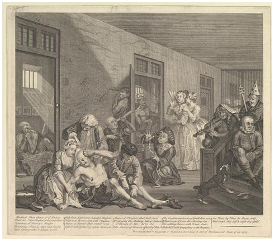
William Hogarth, In the Madhouse, gravure, 1735.

Nous ne savons pas exactement à quand remonte la première mention de constitution d’une telle collection sur le sol européen. Il semblerait toutefois, que l’artiste anglais William Hogarth (1697-1764, peintre et graveur), nous offre le premier témoignage d’un fou dessinant, preuve d’une activité plastique au sein des maisons de santé.