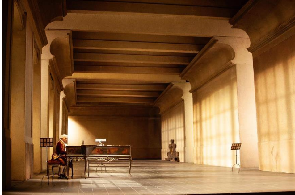
11. Le Nozze di Figaro , de W. A. Mozart, acte III, 2008, photographie de Marco Brescia © Teatro alla Scala.