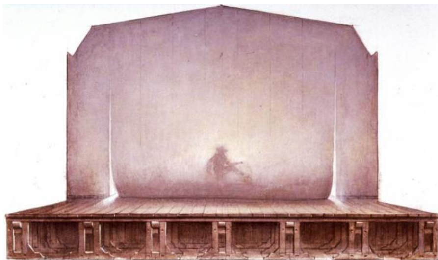
8. Croquis d'Ezio Frigerio pour Arlecchino servitore di due padroni , de Carlo Goldoni, 1987, gouache sur carton, dimensions 43,7 x 31 © Archivio Piccolo Teatro di Milano – Teatro d'Europa.

Grâce aux photos et aux captations vidéo disponibles, nous pouvons analyser la trajectoire du spectacle, à partir du croquis mentionné jusqu'à sa réalisation sur scène. Le rideau de fond dessiné par Frigerio devient, en réalité, un rideau de proscénium, constituant de facto un cadre de scène dont la partie centrale est relevée au début de chaque acte pour permettre le dévoilement du spectacle. Au loin, à sa place, un cyclorama assume des couleurs chaudes ou froides, selon les espaces dramatiques suggérés : ambre, pour la maison de Pantalon et l'auberge de Brighella, bleu léger pour les rues de Venise 7 . Quelques candélabres, posés respectivement sur des tables ou au sol, accompagnent ces changements. Au proscenium, une rangée de chandelles constitue le fil conducteur entre le théâtre moderne et la tradition perdue de la commedia dell'arte . À ce propos, Strehler affirme dans sa note d'intentions :