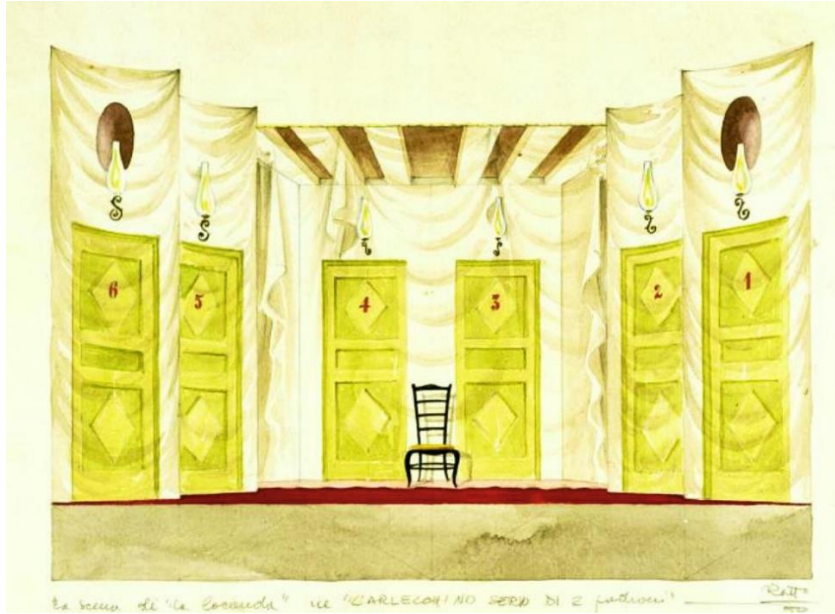
5. Croquis de Gianni Ratto pour Arlecchino servitore di due padroni , de Carlo Goldoni, 1950, © Archivio Piccolo Teatro di Milano – Teatro d'Europa.

Un croquis de Gianni Ratto nous montre la simplicité de cette scène, constituée de toiles peintes et facilement interchangeables. En particulier, concernant la partie de l'auberge, nous pouvons observer la présence de six portes. Une flamme dessinée recouvre chacune d'entre elles. Il suffit de confronter ce croquis, datant de 1950, avec une photographie de la version précédente du spectacle, datant de 1947, pour se rendre compte que l'apparition de ces flammes est une nouveauté. Est-ce le signe d'une volonté de faire référence à l'époque où l'éclairage était assuré par les feux ? En effet, à l'époque de la commedia dell'arte et jusqu'au XIXe siècle, tant les spectacles que les salles de théâtre étaient éclairés à la bougie. S'agissant de sources lumineuses à faible intensité, il était nécessaire d'intervenir avec la peinture sur les décors, pour dessiner ou accentuer les ombres et les lumières.