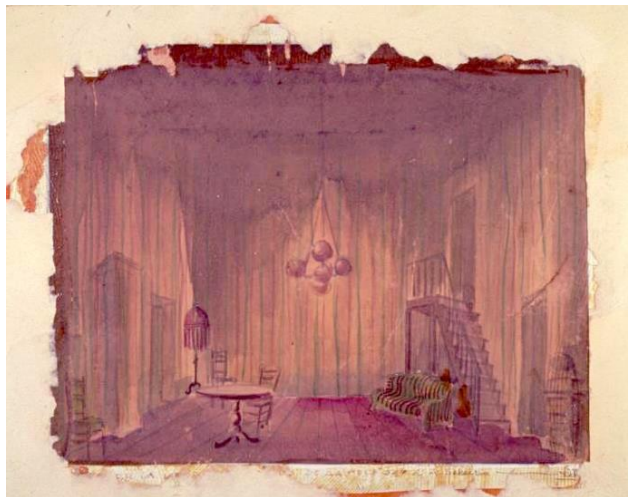
1. Croquis de Gianni Ratto pour Le notti dell'ira ( Les nuits de la colère ), d'Armand Salacrou, © Archivio Piccolo Teatro di Milano - Teatro d'Europa.

Deux croquis de ce spectacle, réalisés par le scénographe Ganni Ratto, nous sont parvenus grâce à l'archivage précieux — aujourd'hui numérisé et en ligne — du Piccolo Teatro.