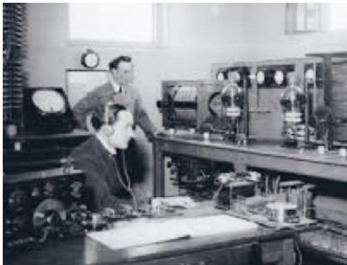
L. Brillouin (premier plan) à l'émetteur TSF « Radio-Paris » de Clichy (photo prise en 1925)

Comme souvent en France, la carrière des physiciens, même internationalement connus, n'est pas vraiment rapide à cause du manque de postes: Brillouin est conférencier à l'École Supérieure d'Électricité de 1921 à 1931. Il devient de 1923 à 1928 sous-directeur au Collège de France attaché à la chaire de Paul Langevin. Il est nommé en 1928 professeur au nouvel Institut Henri Poincaré, créé grâce au mécénat de Rockefeller et de Rothschild, où des fonds sont réservés à l'invitation de professeurs étrangers afin