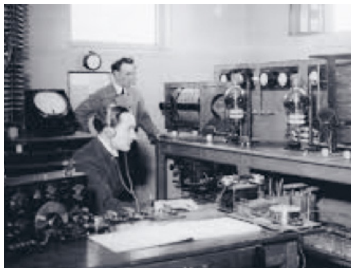
L. Brillouin (premier plan) à l'émetteur TSF « Radio-Paris » de Clichy (photo prise en 1925)

Comme souvent en France, la carrière des physiciens, même internationalement connus, n'est pas vraiment rapide à cause du manque de postes: Brillouin est conférencier à l'École Supérieure d'Électricité de 1921 à 1931. Il devient de 1923 à 1928 sous-directeur au Collège de France attaché à la chaire de Paul Langevin. Il est nommé en 1928 professeur au nouvel Institut Henri Poincaré, créé grâce au mécénat de Rockefeller et de Rothschild, où des fonds sont réservés à l'invitation de professeurs étrangers afin