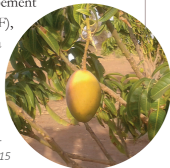
Première mangue du jardin polyvalent communautaire. Widou Thiengoly, Mai 2015