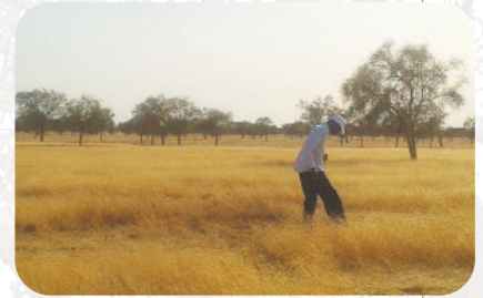
Visite de terrain sur une des parcelles du tracé de la GMV Téssékéré, Mai 2015

décennies de stress climatique, abandon des activités de maraîchage au profit d'un surpâturage extensif avec le développement des élevages d'ovins et de caprins) et impacté par un événement fondateur (la mise en œuvre du projet panafricain de Grande Muraille Verte ou GMV) qui vient bouleverser les socio-écosystèmes en place. Le but étant, comme pour tous les OHM du Réseau "d'identifier et de comprendre les fonctionnements des mécanismes que ce bouleversement induit, d'en déterminer les dynamiques et interactions et d'en suivre les effets et conséquences au cours du temps sur l'homme et son milieu" (Chenorkian, 2012, p.4).