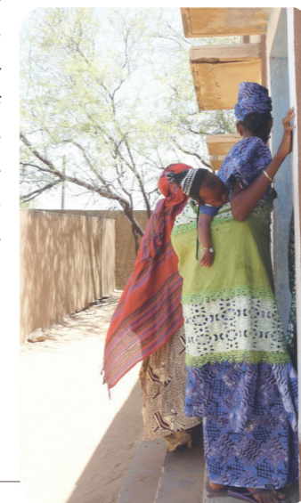
Consultation médicale au dispensaire. Widou Thiengoly, Mai 2015