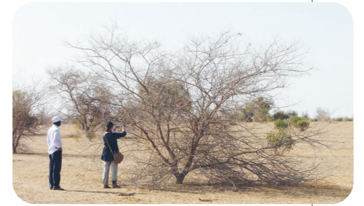
Observation d'un Acacia sp. équipé de microcapteurs (Projet MICROBIOMES-GMV, Peiry JL.) Widou Thiengoly, Mai 2015

divers réseaux compétents dans les champs d'action thématiques de la GMV, et donc l'OHMI, "pour produire à la fois du savoir scientifique et renforcer les capacités d'expertise".