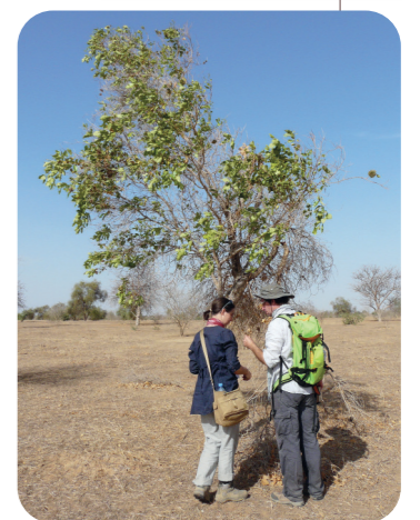
Combretum glutinosum . Widou Thiengoly, Mai 2015

Il est donc essentiel pour l'OHMI de créer une dynamique positive entre les chercheurs de disciplines différentes pour mettre en œuvre les moyens nécessaires à la compréhension des mécanismes d'adaptation en jeu. L'attraction de ce type d'environnement de travail