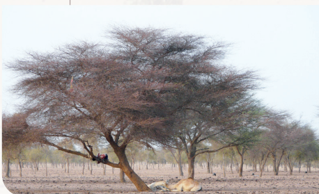
Alignement d'Acacia sp. Widou Thiengoly, Mai 2015

Cette démarche n'est envisageable que si les conditions propices à son établissement sont mises en œuvre : confrontation effective et simultanée de différentes disciplines à une même question, formulation partagée des problématiques de recherche, élaboration d'une communauté de chercheurs d'horizons différents, implication des acteurs du territoire, échanges, communication, valorisation et croisement des données disciplinaires entre chercheurs et auprès des acteurs et usagers, etc. (Chenorkian, 2014).