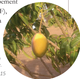
Première mangue du jardin polyvalent communautaire. Widou Thiengoly, Mai 2015

Ce programme s'inscrit ainsi dans une dynamique globale de développement d'une économie verte qui bénéficie des avancées scientifiques et techniques apportées par les recherches soutenues par l'OHMI. Les relations qui se sont établies entre l'observatoire et l'ANGMV "constitue un jalon majeur dans la construction de schémas et de procédés scientifiques et techniques éprouvés et gage de crédibilité dans la démarche" (Cisse, 2012, p. 143). Outre le fait que le programme de la GMV est en train de "capitaliser les acquis scientifiques, techniques, socioéconomiques et institutionnels des expériences passées (...) et de valoriser les savoir-faire locaux et nationaux" (Sarr, 2012, p.61), selon Boëtsch et al. (2012), il doit accompagner les projets de recherche impliquant les