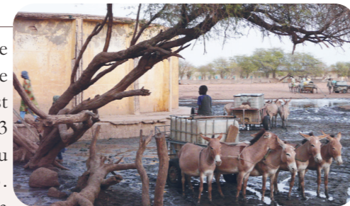
Réservoir d'eau. Widou Thiengoly, Mai 2015

Ce territoire appartient donc aujourd'hui, sur le plan administratif, à l'arrondissement de Yang-Yang, Département de Linguère et Région de Louga, et sur le plan géographique, à la zone sylvopastorale traditionnelle du Ferlo. Cette zone agro-écologique et bioclimatique sahélienne est comprise entre les domaines saharien et soudanien qui couvre selon les études entre 56 269 km 2 (DFCCS, 1991) et 70 000 km 2 , soit près du tiers de la superficie du territoire national. Elle est caractérisée par une longue période sèche de près de neuf mois et une courte période de mousson (trois mois) ; la pluviométrie annuelle ne dépassant pas les 600 mm. Le stress climatique s'accroît depuis la grande sécheresse de 1973 et impacte tant les écosystèmes que les sociétés. Les activités maraîchères ont été abandonnées au profit d'un surpâturage ovin et caprin extensif qui nuit gravement à l'environnement. De plus, cette zone subit une déforestation toujours importante, près de 45 000 ha/an, qui fragilise l'ensemble des écosystèmes et contribue à une emprise accrue de la désertification (Guissé, 2014, Séminaire DRIHM) étayant d'autant plus les actions de l'ANGMV.