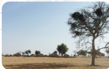
Campement sur la piste menant à Widou Téssékéré, Mai 2015

Les scientifiques qui s'impliquent au sein de l'Observatoire concourent à traiter l'ensemble des problématiques environnementales dans une démarche d'écologie globale au sens de Tatoni et al (2013).