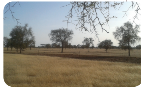
Pare-feux en bordure de parcelle. Widou Thiengoly, Mai 2015

économiques ou culturelles (zones de pâturages, zones de parcours, présence de mares...) (Pape Sarr, 2012). Elles sont cependant mises en défens pour les protéger du passage du bétail et des pare-feux ont été créés pour limiter les incendies de brousse.