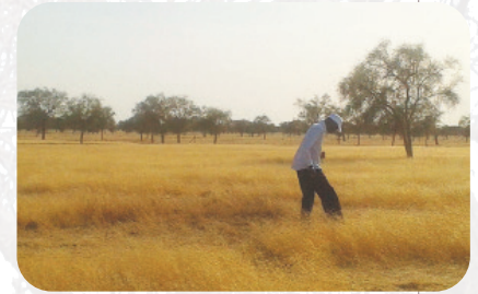
Visite de terrain sur une des parcelles du tracé de la GMV Téssékéré, Mai 2015