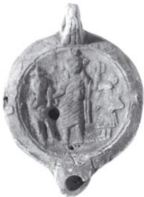
Figure 2 : Lampe S. 1927 du Louvre

Surtout, la lampe porte en creux la marque M OPPI SOSI. Cette marque est intéressante : en effet, elle est caractéristique de lampes italiennes 6 - et non pas africaines - du II e siècle et traduirait donc des échanges commerciaux entre l'Italie et la province d'Afrique.