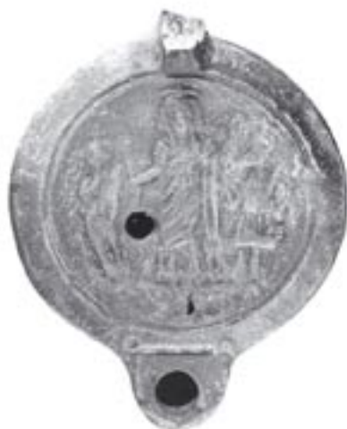
Figure 1 : Lampe 7525 de Saint-Omer

Nos propres recherches permettent d'ajouter à cet inventaire une douzaine d'exemplaires en provenance de France, Italie, Espagne et Afrique. Ce sont justement cinq lampes retrouvées en Afrique, région en apparence à l'écart de ce catalogue, que nous voudrions signaler ici.