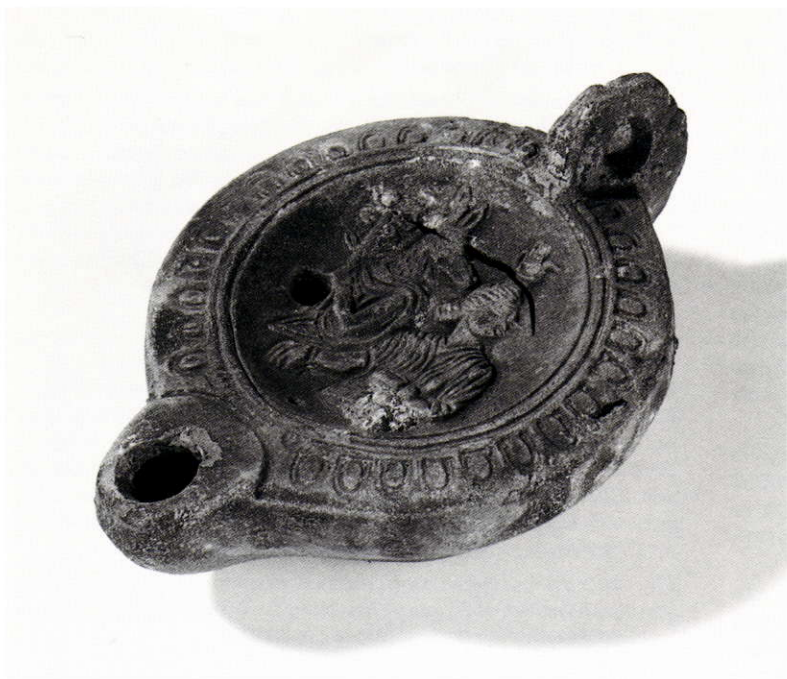
2 Lampe à huile romaine. Anubis et Isis. Luxembourg. Musée national d'Histoire et d'Art.