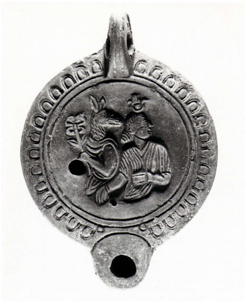
I Lampe à huile romaine 61533. Anubis et Isis . Saint-Germain-en-Laye. Musée des Antiquités nationales.

représentation de la tête d'Isis (fig. 3). Si les vêtements et les bras de la déesse sont correctement figurés, son chignon est compris comme le museau d'un animal qui regarde Anubis tendrement, donc vers la gauche, alors qu'en réalité, Isis semble au contraire se détourner vers la droite. La coiffe est convenablement indiquée. L'anse de cette lampe est cassée, le disque est entouré d' oves , plus nombreux sur le dessin que ceux que nous pouvons dénombrer sur les autres exemplaires. Nous avons donc sans doute affaire au même modèle sortant du même moule 13 . Seul le trou de remplissage est à un autre endroit, entre le visage des deux divinités.