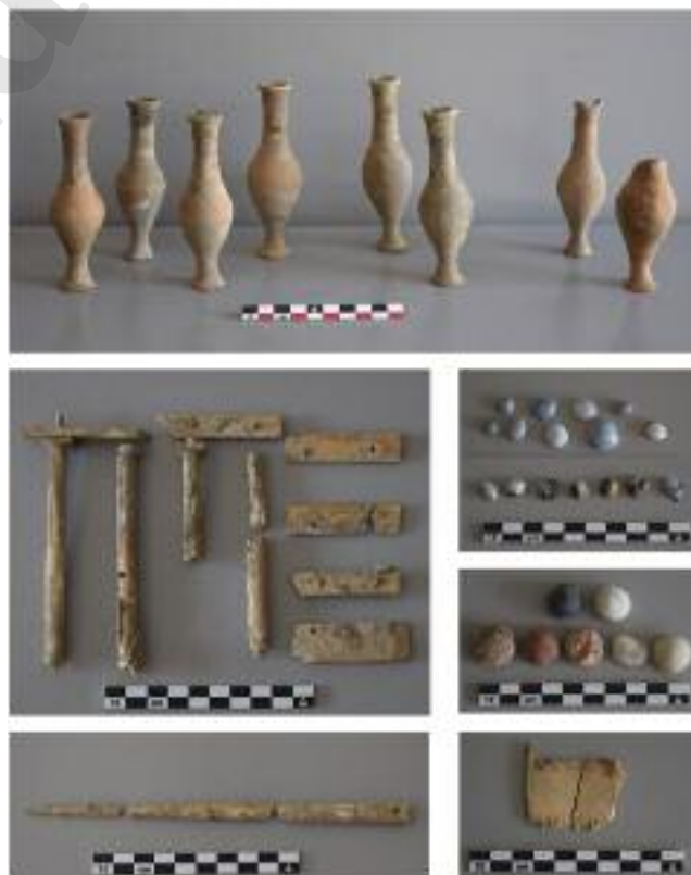
Fig. 8 Elementi dei corredi funerari rinvenuti nella tomba a camera ipogea con volta a botte MSL72006

Leggermente più abbondante è la quantità di materiale rinvenuta in corrispondenza del secondo cassone il cui ingombro si estendeva lungo la parete ovest della camera. In totale sono stati raccolti 23 oggetti la maggior parte dei quali è stata trovata presso l'area sud-ovest della sepoltura. Tra questi 16 pedine da gioco in vetro e pietra, un ciottolo bianco, un pettine in osso a doppi dentelli, una borchietta in bronzo e un piccolo chiodo in ferro ancora fissato al supporto ligneo, questi ultimi probabilmente pertinenti ad una cassetta o un piccolo