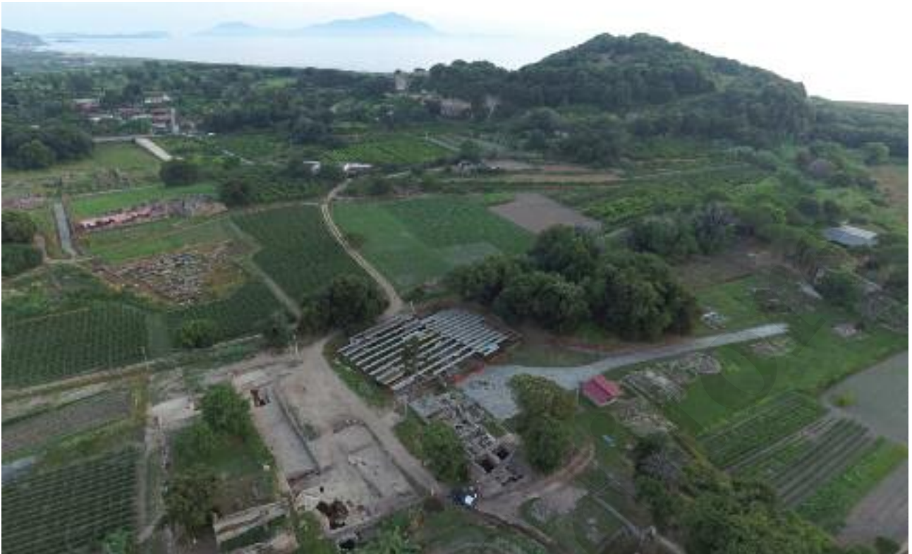
Fig. 1 Il sito di Cuma e in primo piano la necropoli della Porta mediana