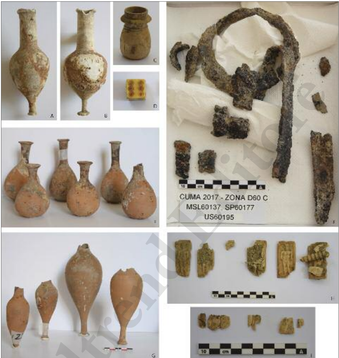
Fig. 20 Elementi dei corredi funerari rinvenuti nel monumento funerario MSL60137

sconvolte. Malgrado ciò è stato possibile recuperare parte dei resti ossei degli individui inumati e soprattutto alcuni elementi dei corredi funerari (fig. 20).