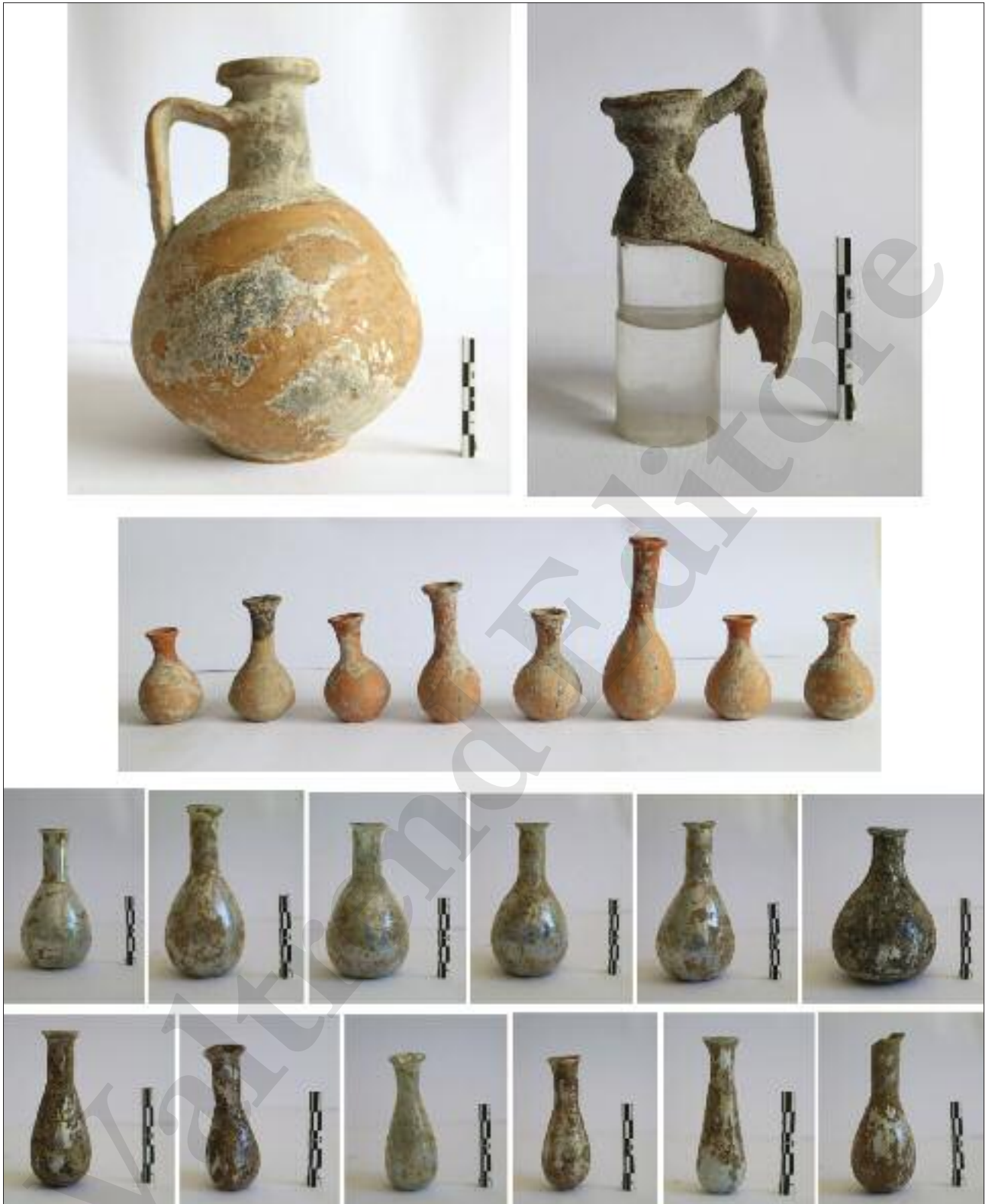
Fig. 22 Elementi dei corredi funerari rinvenuti nel monumento funerario MSL60111

I materiali rinvenuti confermano una frequentazione del monumento ancora nel secondo quarto del I secolo d.C. (fig. 22).