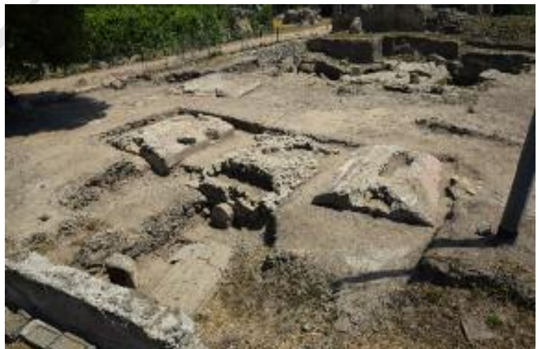
Fig. 12 I mausolei MSL46501, MSL46420, MSL46522 e MSL73178

Esempi già noti delle nuove tipologie, tra