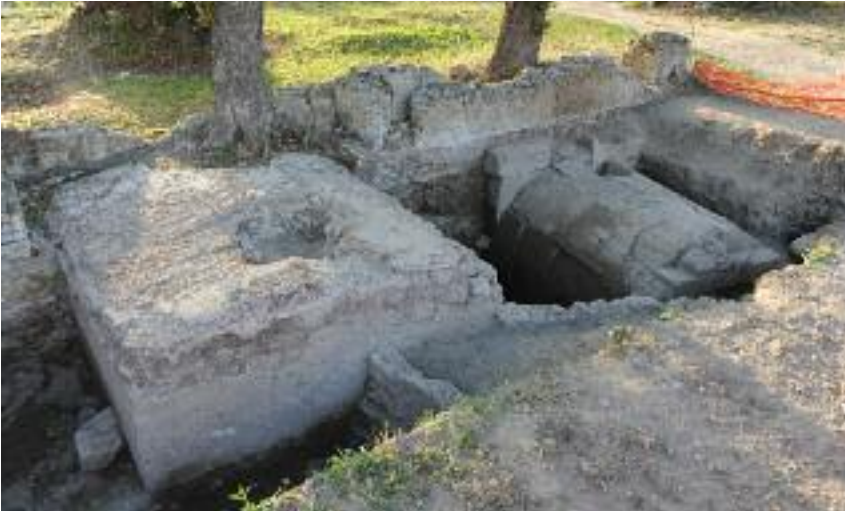
Fig. 16 I monumenti MSL25027 e MSL33001