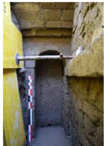
Fig. 15 Interno del monumento funerario MSL60321