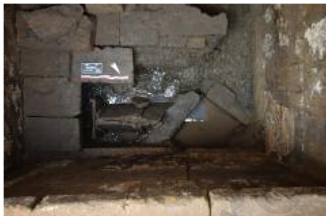
Fig. 5 Le sepolture SP72042 e SP72046

Le altre due sepolture a cassa litica sono riferibili, invece, al tipo "a connola" (SP73253 e SP73246), tipologia che prevede tra le pareti e la copertura una fascia modanata composta anch'essa da blocchi. Lo Stevens nella sua tavola tipologica pubblicata nel 1883 riproduceva diverse varianti in funzione delle dimensioni dei sepolcri o della presenza di nicchie sui lati lunghi 5 .