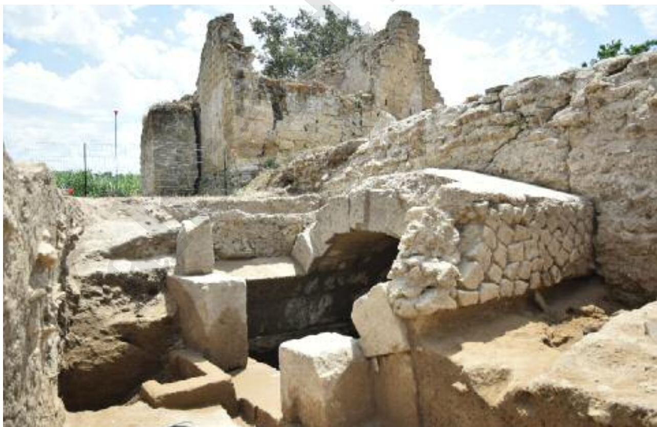
Fig. 7 La tomba a camera ipogea con volta a botte MSL72006

L'edificio funerario MSL72006, la cui struttura portante è realizzata in grossi blocchi di tufo, è del tipo a camera semi ipogea, con facciata imponente e rampa con gradoni che permetteva l'accesso alla struttura da sud (fig. 7). L'interno si presenta a pianta quadrangolare (circa 3,50 per 3,68 m.; altezza 3,50 m.) con copertura a botte e pareti composte sui lati lunghi da tre filari di blocchi sovrapposti e da uno nel quale è ricavata la cornice con una modanatura a cyma reversa . Internamente è rivestito da uno strato di intonaco di colore bianco e a partire dall'estremità superiore della cornice si imposta la volta a botte in blocchi di tufo squadrati, assemblati a secco; essa scarica il suo peso sui muri est e ovest, si sviluppa per una lunghezza di 2,78 per 1,20 m. di