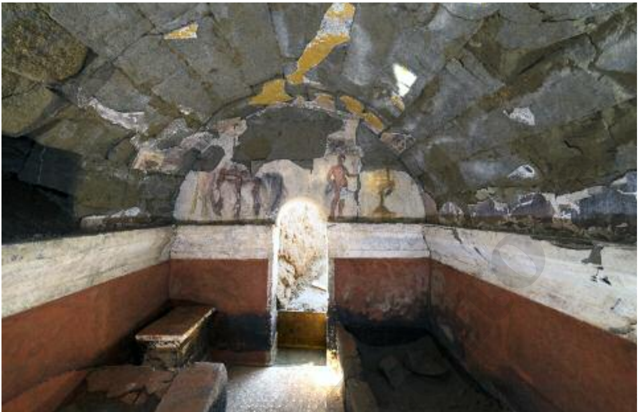
Fig. 9 Interno della tomba a camera ipogea con volta a botte MSL73101

L'ambiente è organizzato con tre letti, disposti lungo le pareti ovest, nord ed est (SP73129, SP73125, SP73127), e una mensa. La struttura di ciascun letto è costituita da grandi lastre di tufo squadrate, poste di taglio a crearne il perimetro, successivamente riempito da un misto di terra e frammenti di tufo giallo di piccole dimensioni, tutti gli elementi erano ricoperti da intonaco di colore rosso chiaro. I letti sono dotati di un pulvino all'estremità.