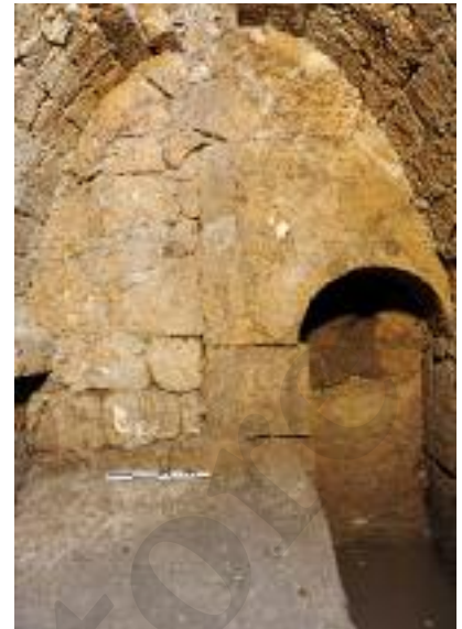
Fig. 14 Interno del monumento funerario MSL29027

i monumenti indagati negli anni passati, sono i mausolei MSL29027 19 e MSL33001 20 , posti poco più a nord lungo l'asse nord-sud (D), nelle immediate vicinanze della tomba con volta a botte MSL25027 scavata da Andrea de Jorio nel 1818 e indagata di nuovo nel 2010 21 .