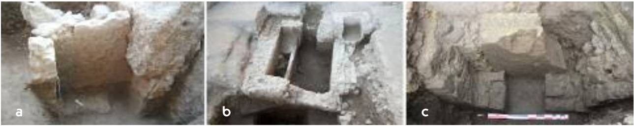
Fig. 18 I mausolei MSL46346, MSL46144, MSL46175

17) 23 . Già manomesso, era comunque ben conservato. Il monumento è orientato ovest-est e presenta una pianta pressoché quadrangolare (esterno 3,00 x 2,70 m.; interno 2,65 x 2,35 m.). All'esterno, la parte esposta (circa 0,85 m.) è rivestita da uno strato di intonaco bianco. La volta è ricoperta da uno spesso strato di cocciopesto che viene ad appoggiarsi a una cornice aggettante composta da un filare di elementi rettangolari di tufo. Sul tetto è presente un grande foro realizzato dagli scavatori clandestini. L'interno della camera è coperto da una volta a botte, realizzata in blocchetti regolari di tufo di forma rettangolare posti di taglio, legati con malta e disposti a raggiera; quest'ultima poggia su una cornice sporgente. Tre letti funebri sono costruiti lungo le pareti nord, est e sud; sono formati da muretti realizzati con scapoli irregolari di tufo, assemblati con malta e da un riempimento di terra, con un rivestimento di intonaco rosso. L'interno è ricoperto di intonaco bianco e il pavimento è in cocciopesto. Nessun elemento del corredo funerario è stato recuperato, ma la sequenza stratigrafica indagata permette di confermare un inquadramento del monumento tra il secondo quarto e il terzo quarto del I secolo a.C.