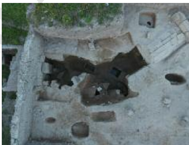
Fig. 6 La galleria CN73043 e le sepolture a cassa SP73250, SP73253 e SP73246