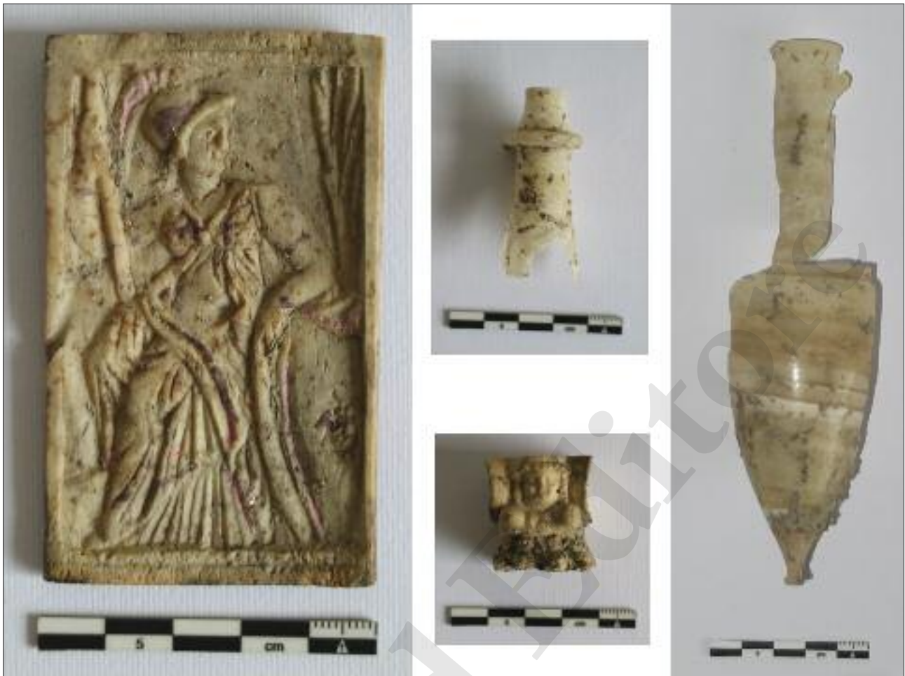
Fig. 10 Elementi dei corredi funerari rinvenuti nella tomba a camera ipogea MSL73101

metà del I secolo a.C. Non è escluso che la cassetta possa essere interpretata come un'alabastroteca, ovvero un contenitore per vasi in alabastro poiché i due piccoli contenitori appena descritti, sprovvisti di base di appoggio, necessitavano di un supporto per stare in posizione verticale.