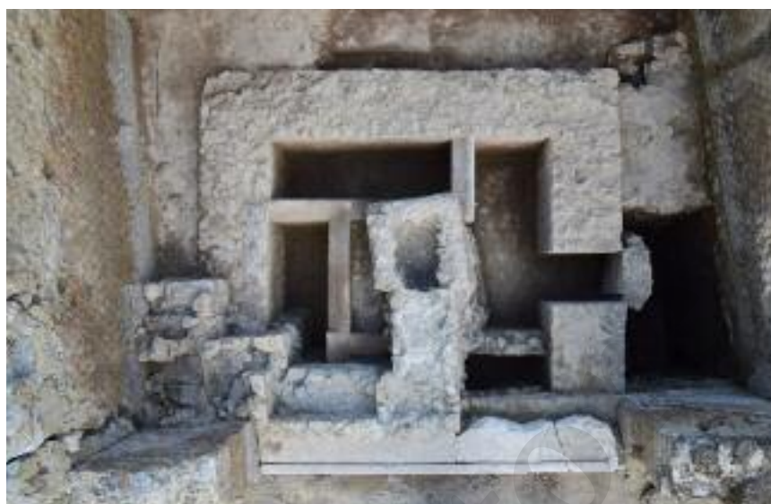
Fig. 21 Il monumento funerario MSL60111

Il letto nord SP60246 risultava anch'esso al momento dello scavo manomesso. Su di esso erano presenti i resti di due inumati. Una riduzione con un primo individuo è stata riconosciuta nella parte ovest del letto, mentre un altro individuo, deposto supino e con il capo a est, risultava essere stato collocato in un secondo momento sul letto. Probabilmente all'ultima inumazione sono riferibili i 9 unguentari (tipi CUM-UNG A.II, CUM-UNG B.III e B.IVb) e la lucerna delfiniforme (tipo ibrido tra la Dressel 2 e Dressel 3), la cui datazione va collocata nel pieno I secolo a.C. A questi oggetti vanno aggiunte due monete riferibili al periodo tardo repubblicano la prima e alla prima età imperiale la seconda.