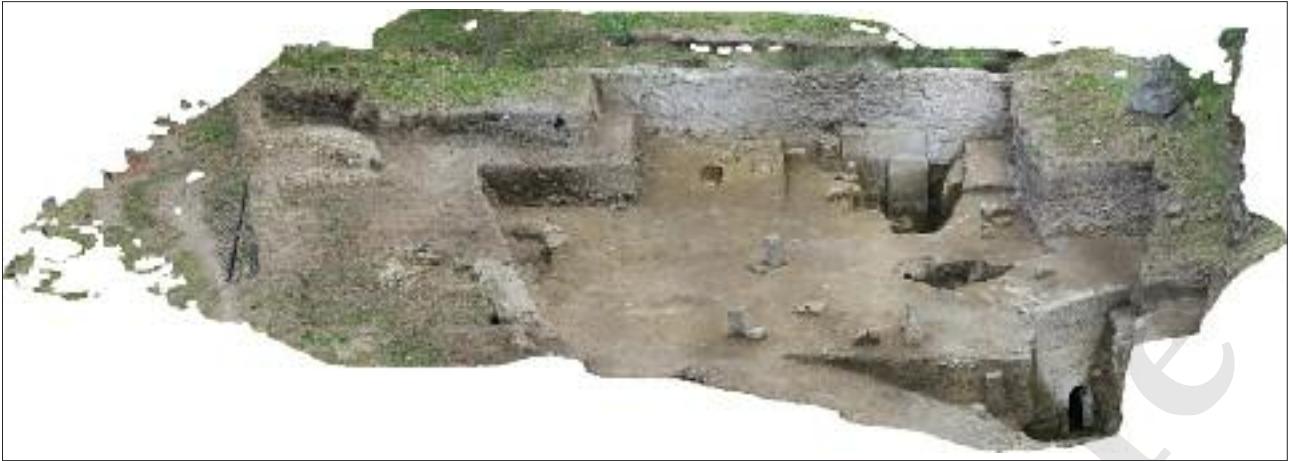
Fig. 11 Fotogrammetria dell'area in cui ricadono le due tombe a camera MSL72006 e MSL73101 e le tombe a cippo

affiancato da un'anfora in posizione verticale forse come segnacolo, o come ulteriore sepoltura. Il monolite US 73164, presso il limite nord-occidentale dell'area, presenta una decorazione geometrica incisa sulla faccia sud che ne determina il probabile orientamento. Il cippo US 73168, a ovest di MSL73101, presenta la faccia meridionale ancora parzialmente coperta da uno strato di intonaco. A nord-ovest del segnacolo funerario US 73168 sono presenti altre due tombe: il cippo US 73165 con mensa, è posizionato in senso sud-est/nord-ovest; l'altra tomba, la SP73167 sembra costituita da due blocchi subquadrati sovrapposti e ricade quasi integralmente nel tracciato dell'asse viario VO73161.