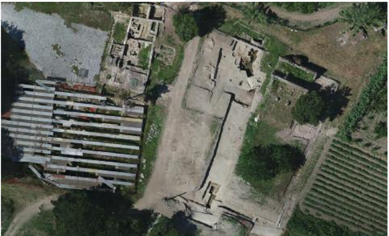
Fig. 2 Ortofotogrammetria della necropoli della Porta mediana (real. R. Catuogno, DiStar UniNa, M. Facchini, MLab UniNa, M. Giglio, UniOr)