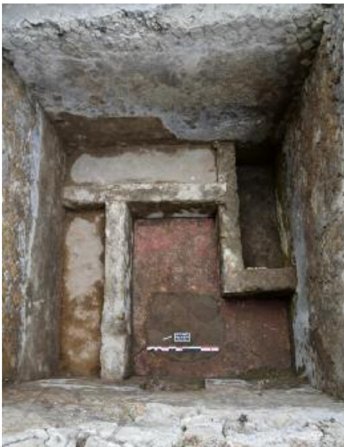
Fig.19 Il monumento funerario MSL60137

L'edificio funerario MSL60137 è del tipo a camera semi ipogea, con copertura a volta a botte e accesso verso ovest (fig. 19). Il mausoleo si compone di un ambiente a pianta pressoché quadrata con suolo in cementizio e rubricatura sulla superficie. Le murature sono in opera quasi reticolata conservate per circa 3 m. in elevato. Della volta in cementizio oggi si conserva solamente un lacerto. All'esterno i muri, rivestiti di uno strato di intonaco, abbastanza grossolano e di colore grigio-bianco, presentavano un paramento realizzato con la stessa tessitura delle murature della camera funeraria. All'interno, in alcuni punti, si conserva un rivestimento di intonaco dipinto a fondo giallo con motivi vegetali (?). La camera è organizzata con tre letti costruiti in muratura, cavi e riempiti di terra, che si dispongono lungo le pareti nord (SP60246), est (SP60174) e sud (SP60177). Le deposizioni sui letti erano completamente