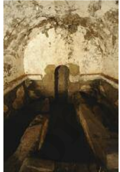
Fig. 17 Interno del mausoleo MSL33001

in blocchetti regolari di tufo, di forma rettangolare, messi di taglio e disposti a raggiera.