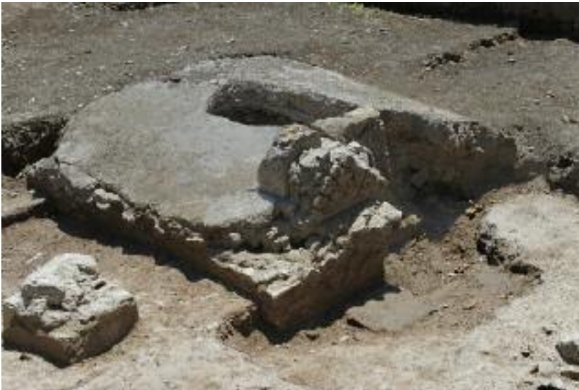
Fig. 13 Il mausoleo MSL29027