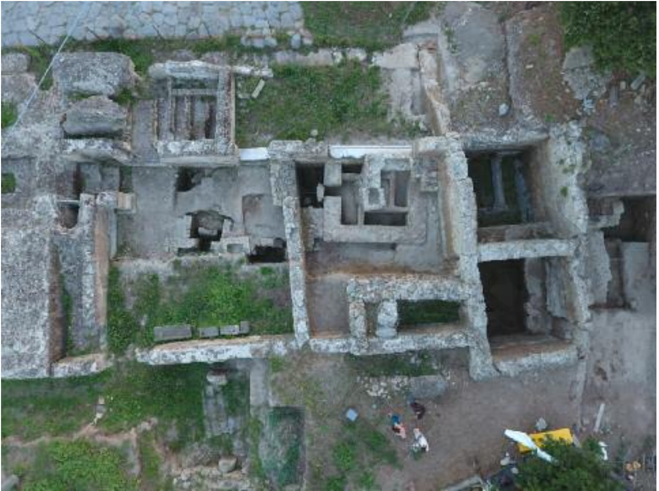
Fig. 23 Il complesso di età traianea e i monumenti funerari oblitterati

talizzazione della corte antistante 28 . Durante questo intervento edilizio vengono rialzati i piani per la realizzazione di una grande terrazza immediatamente a est della Porta, tra le mura e il settore occupato dalla masseria settecentesca di Matteo Scotto d'Aniello detto il "Procidano". Queste operazioni hanno avuto lo scopo di spianare una grande porzione di terreno, utile alla costruzione di un complesso provvisto di un considerevole spazio esterno ipotizzabile come un campus di addestramento. L'intera superficie appare oggi estesa su almeno 2500 metri quadrati e conserva ancora, a nord e a est, i muri perimetrali in fondazione, mentre a sud viene ad appoggiarsi direttamente al raddoppiamento delle fortificazioni di età ellenistica. In questa fase l'asse stradale secondario diretto a est verso il Monte Grillo viene oblitterato e il settore di necropoli a est del piazzale inglobato nel terrapieno della terrazza.