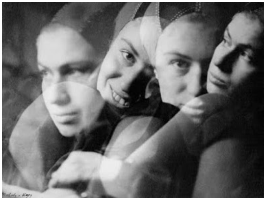
Laszlo Moholy-Nagy, Portrait multiple , vers 1927. Museum Folkwang, Essen.

Il est d'ailleurs rassurant de constater que les avant-gardes de la première moitié du XX e siècle, ces mêmes avant-gardes qui sont parfois montrées du doigt pour avoir songé aux « fabriques de l'homme nouveau », idée flirtant dangereusement avec un scientisme pas toujours conscient de ses sensibilités totalitaires, n'ont jamais connu la tentation de la photographie anthropologique à la Galton. Et les quelques portraits photographiques jouant sur la juxtaposition de plusieurs prises, dont celui de Multiple Portrait de Laszlo Moholy-Nagy de 1927 est vraisemblablement le plus proche de la photographie composite, conçoivent cette opération comme un nouvel outil expressif. Rien de plus. L'expression esthétique permet ainsi de retrouver la liberté et la dignité de l'individu. On l'a dit : alors que les photos de Marey ou Muybridge ont exercé une influence impérieuse sur la peinture, celles de Galton sont tombées dans un oubli profond. Bien plus tard, le retour de la photographie composite se fera justement – n'est-ce pas étonnant ? ! – sur un mode ironique du Witz .