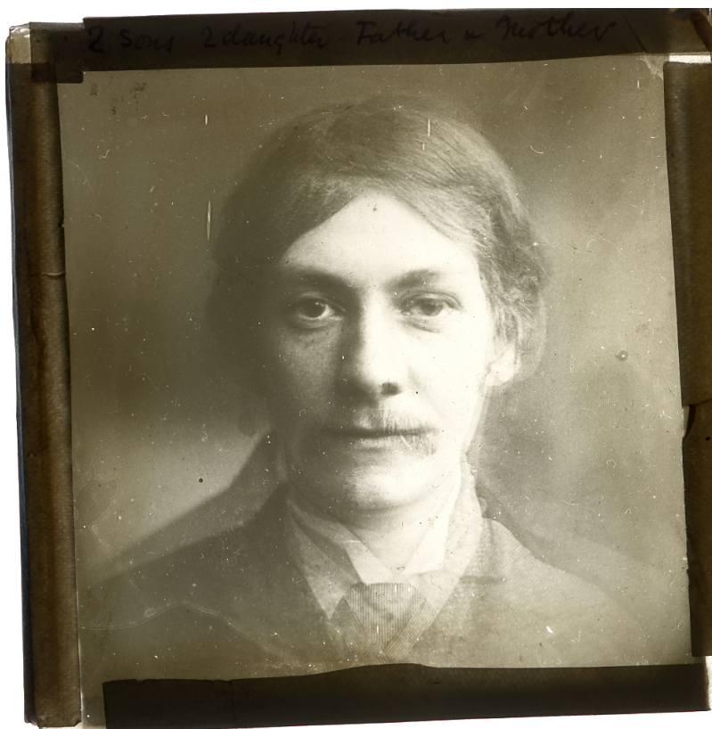
Francis Galton, co-composite familial comprenant un père et sa femme, leurs deux filles et deux fils, le frère du père et son fils