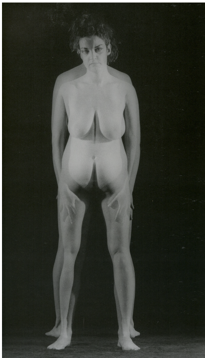
Krzysztof Pruszkowski, Doloreze recto-verso. Fotosynteza , 1984