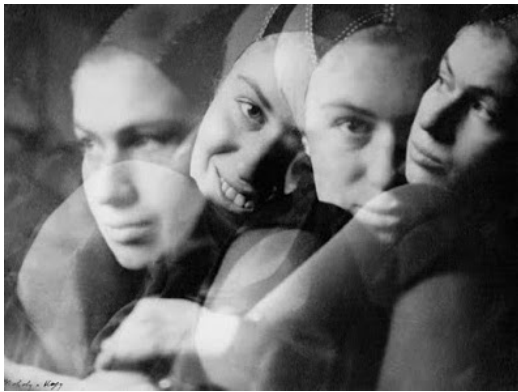
Laszlo Moholy-Nagy, Portrait multiple , vers 1927. Museum Folkwang, Essen.

Il est d'ailleurs rassurant de constater que les avant-gardes de la première moitié du XX e siècle, ces mêmes avant-gardes qui sont parfois montrées du doigt pour avoir songé aux « fabriques de l'homme nouveau », idée flirtant dangereusement avec un scientisme pas toujours conscient de ses sensibilités totalitaires, n'ont jamais connu la tentation de la photographie anthropologique à la Galton. Et les quelques portraits photographiques jouant sur la juxtaposition de plusieurs prises, dont celui de Multiple Portrait de Laszlo Moholy-Nagy de 1927 est vraisemblablement le plus proche de la photographie composite, conçoivent cette opération comme un nouvel outil expressif. Rien de plus. L'expression esthétique permet ainsi de retrouver la liberté et la dignité de l'individu. On l'a dit : alors que les photos de Marey ou Muybridge ont exercé une influence impérieuse sur la peinture, celles de Galton sont tombées dans un oubli profond. Bien plus tard, le retour de la photographie composite se fera justement – n'est-ce pas étonnant ? ! – sur un mode ironique du Witz .