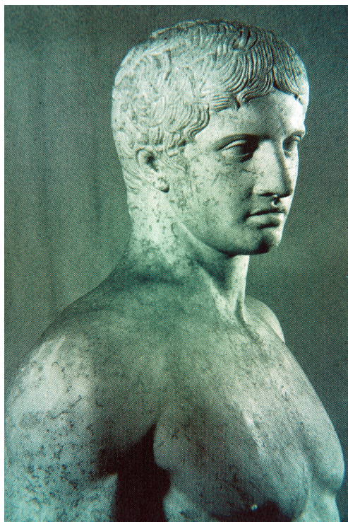
Copie présumée de Doryphore de Polyclète.

séquent il problématise l'articulation entre l' Idée-norme et l'idée de l'espèce, ce qui précisément fait défaut aux analyses de Galton.