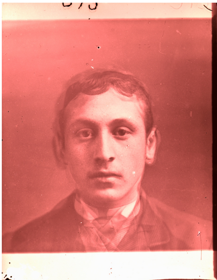
Francis Galton, composite de Juifs