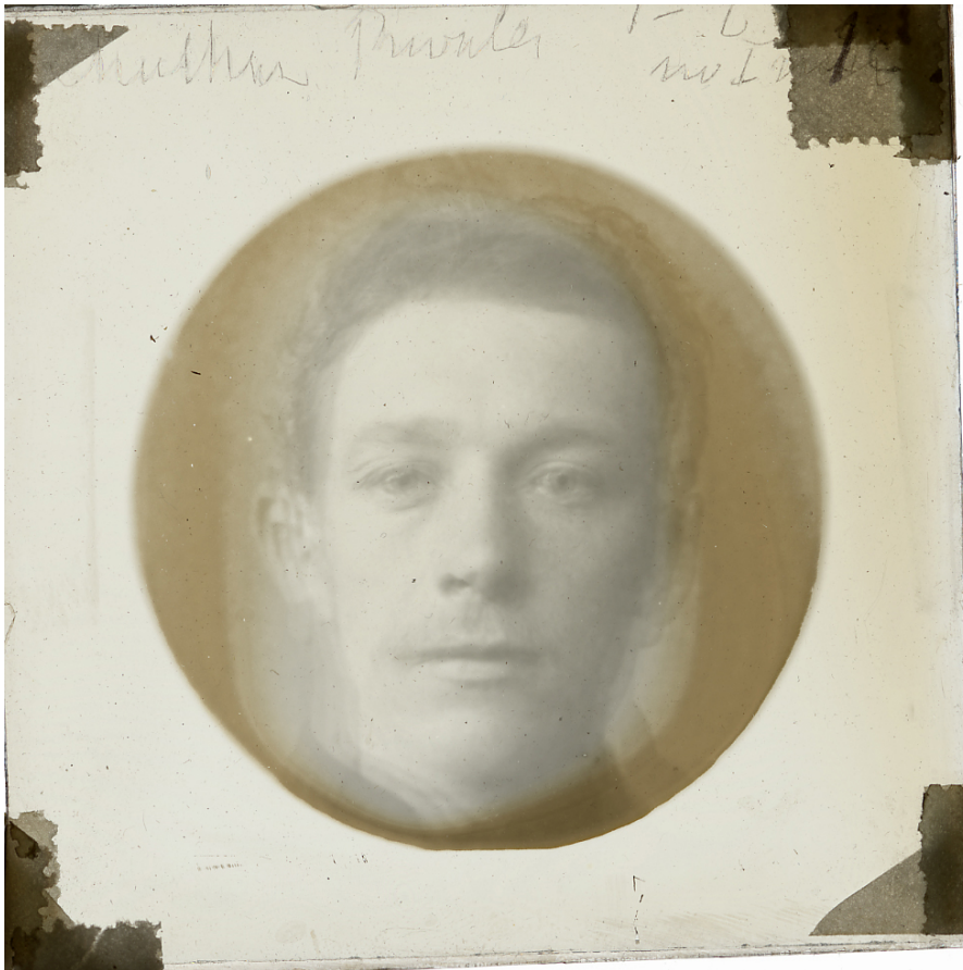
Francis Galton, composite de soldats de l'armée, © University College London.

Le rappel du fond de ce débat non seulement permet de clarifier les implications idéologiques de la notion même d'idéal, mais prépare aussi l'analyse du rapport de l'universel et de l'individuel qui la sous-tend et qui se trouve formulé en de nouveaux termes dans la conception tardienne de l'identité individuelle.