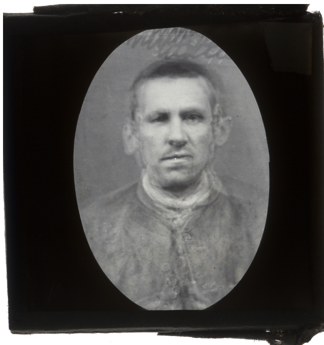
Francis Galton, composite de condamnés pour crimes violents, © University College London.