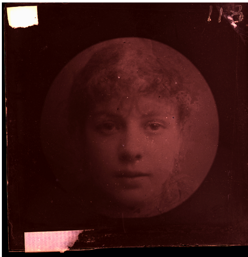
Francis Galton, composite de phtisiques, © University College London.

À ces considérations de Polyclète (V e siècle av. J.-C.) va se superposer au cours de l'histoire de l'idéal la théorie de l'expérience, conçue par Aristote au IV e siècle av. J.-C. pour expliquer le fonctionnement des représentations mentales (perception, connaissance, reconnaissance), et non pas des représentations artistiques de l'idéal. « Quand une telle persistance [des impressions sensibles] s'est répétée un grand nombre de fois », écrit Aristote dans les Secondes analytiques , « une autre distinction dès lors se présente entre ceux chez qui, à par-