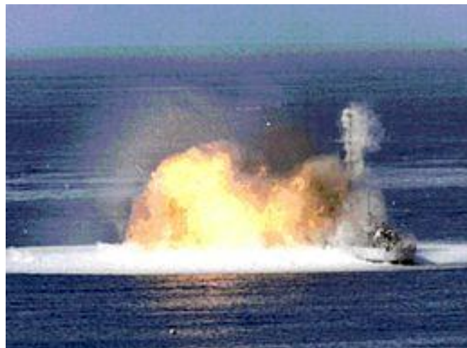
Figure 3. Tir d'un fuel air explosive de l'US Navy contre un navire cible, l'USS McNulty (en), en 1972. 9

Délaissé depuis les années 1970/1980, le lance-flammes est remplacé dans la plupart des armées par les armes thermobariques (Figure 3).