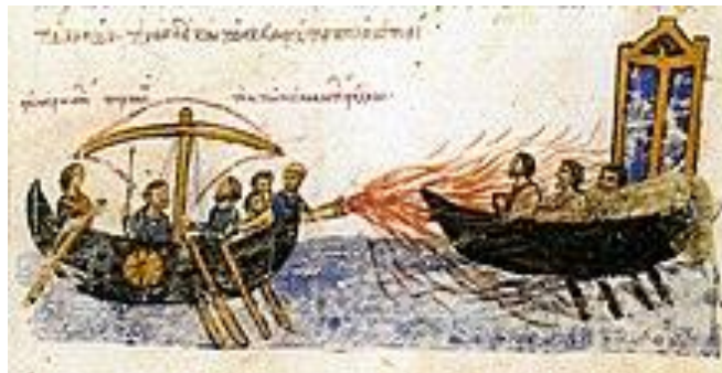
Figure 1. Image du XII e siècle illustrant l'usage par la marine byzantine de feu grégeois contre la flotte rebelle de Thomas le Slave entre 820 et 823. 7

L'arme peut également permettre d'incendier des bâtiments ou des véhicules.