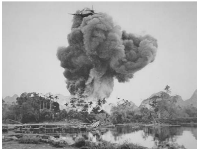
Figure 5. Bombardement français au napalm sur Phu Nho Quan, pendant la guerre d'Indochine en 1954.