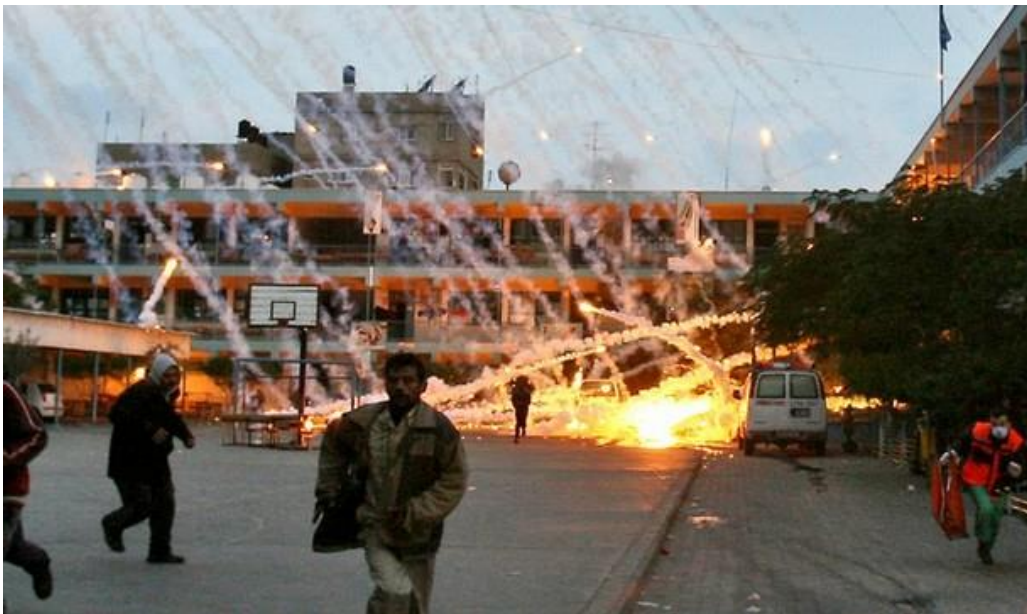
Figure 7. Gaza : pourquoi l'usage de bombes au phosphore blanc est un crime de guerre

L'usage de ce type d'arme est dévastateur. Les particules incandescentes de phosphore blanc – encore « affectueusement » appelé Willy Pete 14 par les soldats britanniques lors de la Seconde Guerre mondiale et US au Viêt-Nam – pénètrent profondément dans la peau, jusqu'à faire fondre l'épiderme, les chairs et les os. Le phosphore blanc cause des brûlures chimiques multiples qui peuvent continuer à brûler dans le corps, même en l'absence d'oxygène extérieur. « Généralement, lorsqu'un patient présente une brûlure, on sait la soigner, et surtout il n'y a pas de détérioration, raconte le docteur Nafez Abou Shaaban, chef du service des brûlés à l'hôpital Shifa. Là, non seulement c'était impossible, mais en plus la plaie s'élargissait de plus en plus et, après quelques heures, de la fumée blanche s'en échappait. La seule solution que nous avions était d'amener le plus rapidement possible le patient en salle d'opération » 15 . Ces brûlures sont souvent au deuxième et troisième degré.