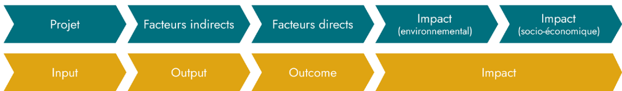
Figure 1 : représentation simplifiée des chaînes de causalité à l'origine d'un impact environnemental. Cette figure montre d'un côté la représentation dite « DPSIR » (Driver-Pressure-State-Impact-Response), en bleu-vert, élaborée par l'Agence européenne pour l'environnement, permettant l'évaluation des impacts environnementaux de projets et politiques publics et d'un autre côté, l'impact value chain, en jaune, recommandée pour l'évaluation des impacts de projets privés (Durand, Rodgers et Lee, 2019). Les deux derniers exemples décrivent une évaluation des impacts au niveau des projets, menée directement dans une optique coût-efficacité en lien avec des objectifs environnementaux, comme cela sera discuté plus bas.

Des évaluations socioéconomiques (ESE) sont aussi exigées lorsque les investissements mobilisent plus de 20 M€ de financement public de l'État et de ses opérateurs. Par comparaison aux EIE, les ESE s'inscrivent dans un cadre théorique cohérent et en sont à un stade de maturation plus avancé. Les ESE doivent être effectuées selon des procédures étroitement encadrées et elles sont soumises à une gouvernance stricte. Leurs résultats sont inclus dans les