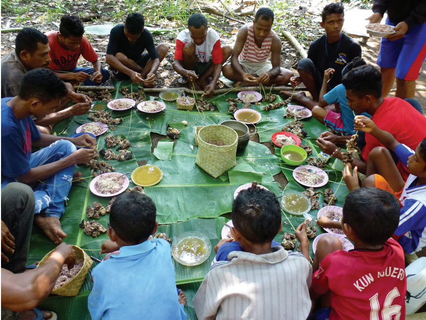
Fig. 5. Le déjeuner de brochettes, Keka', 20 avril 2017