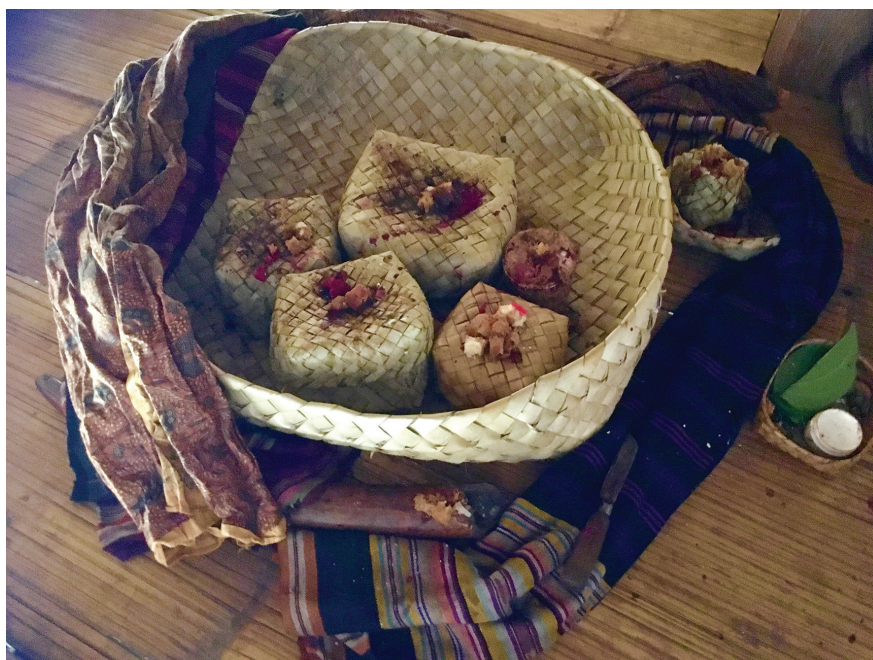
Fig. 7. La corbeille d'esprits auxiliaires, Waiklibang, 29 avril 2017