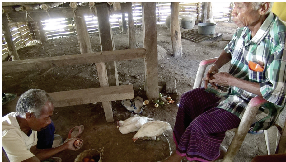
Fig. 6. La corbeille d'offrandes devant l'orateur, Waiklibang, 29 avril 2017