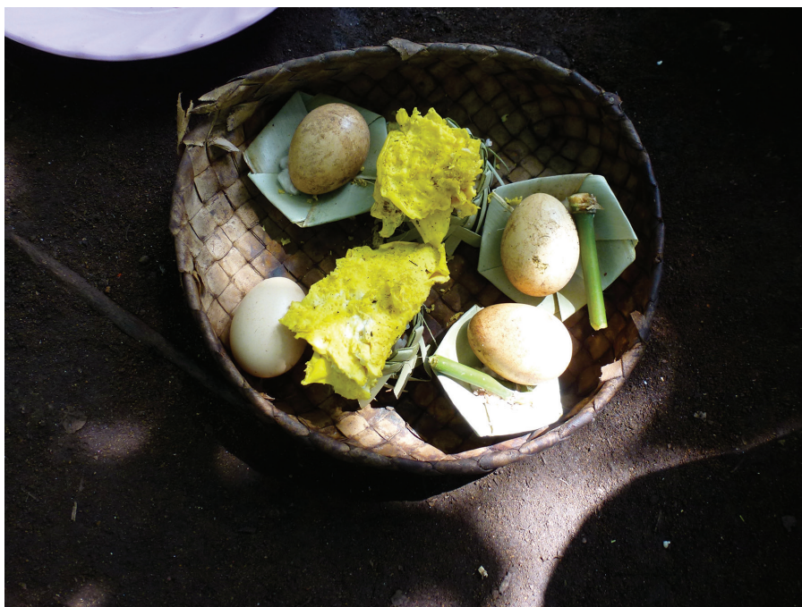
Fig. 3. Les œufs dans la corbeille d'offrandes, Keka', 20 avril 2017

Pour cela, le cultivateur convie trois personnes : un orateur, le représentant de son clan et le « maître de la terre » 16 . Le cultivateur confectionne d'abord une corbeille d'offrandes dans laquelle des ingrédients sont ordonnés avec méticulosité : aux quatre coins de la corbeille sont disposés des œufs. Trois d'entre eux, bordés de coton, sont posés sur un support végétal. Au quatrième coin, un autre œuf est posé, sans support, sans coton. Au centre, deux petites corbeilles tressées sont remplies de riz cuit, surmonté par une omelette (fig. 3). Chacun des œufs posés sur les supports végétaux est accompagné d'un tout petit tube de bambou figurant le récipient contenant le vin de palme.