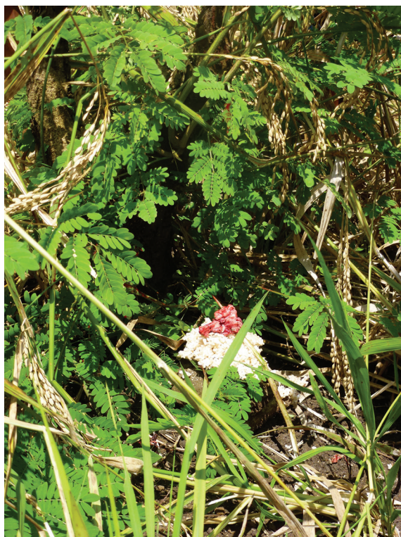
Fig. 4. Brochette offerte aux invisibles, champ de Kons Brinu, Keka', 20 avril 2017

Puis, accompagné des trois hommes, le cultivateur part dans son champ avec une corbeille pleine d'œufs et un cochon. Les offrandes sont présentées devant un petit autel pour la divinité du riz (Tono Wujo), figurée par un tissu et une noix de coco, puis l'orateur commence par psalmodier une série de trois poèmes ( tutu marin ). Après le premier poème, un œuf est fendu, puis posé dans la corbeille, sur son assiette végétale, et ensuite offert à un coin du champ. Après le deuxième poème, il en va de même, le deuxième œuf est déposé au coin opposé du champ. Enfin, le troisième poème est suivi de la décapitation d'un cochon dont le sang est oint sur la noix de coco destinée à rafraîchir la divinité du riz. Du cochon sont prélevés plusieurs morceaux crus enfilés sur « une brochette » ( bewelak ), déposée dans un buisson avec du riz cuit (fig. 4). Le reste du cochon est cuit au grenier du champ. Après avoir nourri les invisibles, un repas est préparé lors duquel seuls les jeunes garçons (enfants, jeunes hommes), assis en rectangle, viennent manger du riz, du bouillon et de la viande. Durant ce déjeuner, ces derniers se fabriquent une brochette de viande cuite qu'ils rapporteront chez eux (fig. 5). Si le rituel est exécuté à l'échelle du clan et non d'une seule famille, alors le repas sera encore plus animé par le nombre de convives.