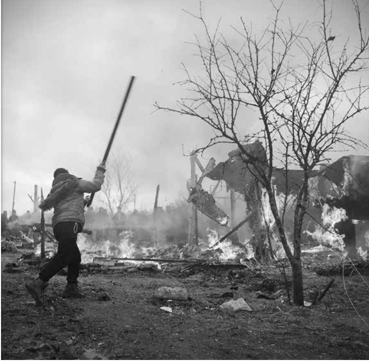
Case bruciate durante lo smantellamento della zona sud, marzo 2016

lotta. In realtà, non facevano altro che anticipare il peggio, per prevenirlo: si trattava come di impedire ai migranti di distruggere le loro stesse capanne, e di lanciarne i resti contro le pareti delle altre capanne. A ogni incendio, cui seguivano le demolizioni improvvisate, una troupe televisiva si avvicinava per osservare, senza commentare troppo, questa distruzione anticipata rispetto all'orario ufficiale. Su BFM TV, l'allora prefetto della regione Nord-Pas-de-Calais, Fabienne Buccio, sosteneva essere “una tradizione della popolazione migrante distruggere il proprio habitat prima di partire”. La reazione delle associazioni presenti nella Giungla fu proporzionale alla pigrizia intellettuale del prefetto.