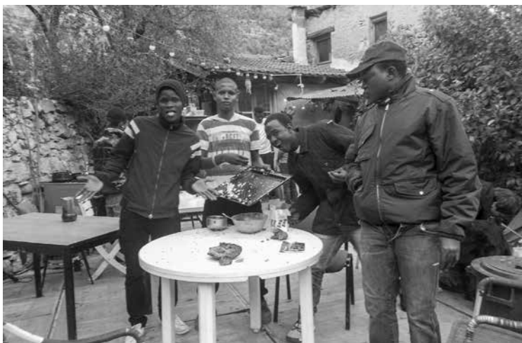
Ragazzi nel camping solidale di Breil-sur-Roya

dell'Italia e della Francia in materia di accoglienza e fornire agli esiliati il minimo vitale: pasti, vestiti, assistenza medica, ospitalità... altri pensano che bisogna allo stesso tempo portare avanti una battaglia politica. In tutti i modi, la politica raggiunge rapidamente l'umanitario ed è lì tutte le sere, con la presenza delle forze dell'ordine, il controllo dei documenti di coloro che distribuiscono il cibo, le ordinanze del sindaco di Ventimiglia che vietano la distribuzione dei pasti ai rifugiati... È lì quando a due riprese, a marzo, coloro che distribuivano i pasti sono rimasti bloccati per diverse ore nei locali della polizia di Ventimiglia; la situazione si è in seguito sbloccata solo grazie alla pressione mediatica. La politica è lì con la decisione istituzionale di non fornire l'accesso all'acqua ai migranti, anche in piena estate; è lì con la non apertura dei centri di accoglienza, quando erano previsti uno per i minori e uno per le famiglie, è lì con i rastrellamenti e i respingimenti (Roya Citoyenne 2018: 1).