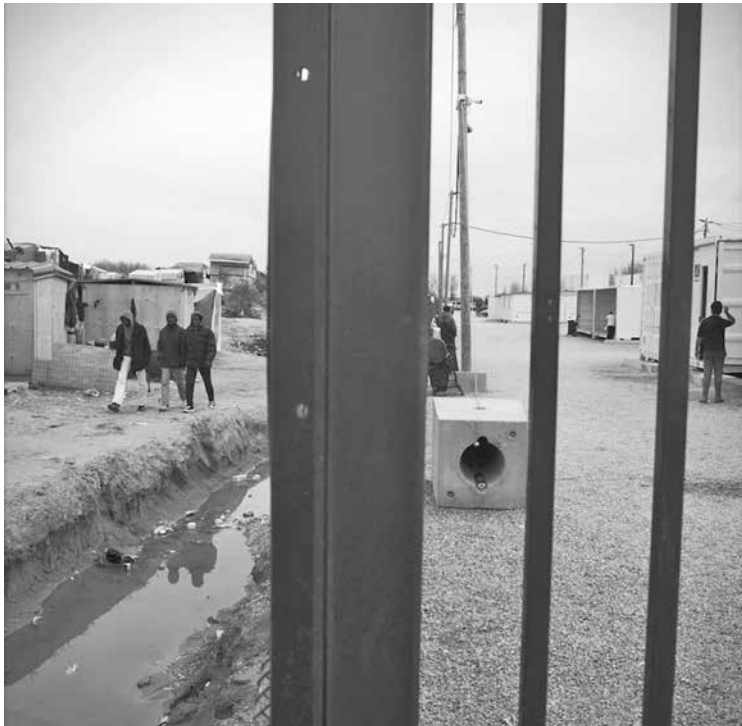
Il “Centro d'accoglienza provvisorio”, costruito nel bel mezzo della Giungla

misto di inglese e francese cercavano di spiegare: “L’area meridionale deve essere evacuata, perché le case saranno distrutte; avete due opzioni: o andate al campo dei container, dove potete richiedere asilo qui o in Inghilterra, oppure prendete un autobus (in partenza ogni mattina) per una città, il cui nome vi verrà fornito alla partenza, per raggiungere un centro di accoglienza per richiedenti asilo; potrete presentare domanda di asilo lì, con il vantaggio di farlo in un’amministrazione meno saturata; fate come preferite; dipende da voi, non siete obbligati a fare nulla, ma dovete scegliere”.