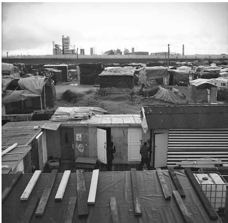
Panoramica della Giungla

ha mai sostenuto di costituire un quadro di riferimento per la vita sociale oltre le sue specifiche competenze. La distribuzione e la segmentazione delle attività era tale che nessuna singola struttura o istituzione poteva garantire da sola la sostenibilità economica della Giungla e, nel migliore dei casi, esse erano responsabili solo di una funzione sociale. Né la warehouse , un enorme capannone pieno di materiali (vestiti e altro), né la “scuola della Giungla” o la chiesa etiopica hanno contribuito singolarmente a organizzare in modo sostenibile la vita dei migranti.