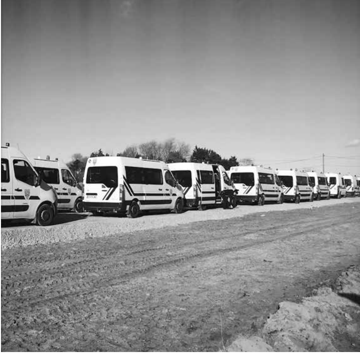
Furgoni delle forze dell'ordine stazionati davanti all'entrata della zona sud della Giungla

pubbliche di costruirne una controparte in muratura: nel gennaio 2016 è stato allestito un “centro di accoglienza temporanea”, composto di prefabbricati metallici poggiati su fondamenta di cemento, nonché da strade asfaltate che hanno gradualmente coperto i sentieri sabbiosi. Per i sudanesi che abbiamo incontrato, la costruzione di una strada sul “sentiero delle dune”, ai margini della Giungla, aveva al limite migliorato la qualità delle partite di calcio che lì si giocavano. In effetti, la paura instillata dal discorso mediatico e istituzionale in chiave securitaria e l'estetica concentrazionaria di questo centro di accoglienza temporaneo hanno rapidamente lasciato il posto alla strana impressione di camminare in un villaggio pieno di attività. Tuttavia, al nostro