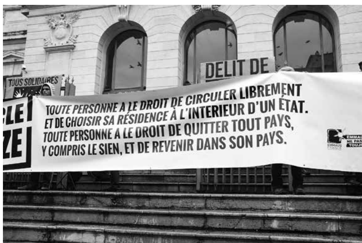
Striscione per la libertà di circolazione, davanti al Tribunale di Nizza in occasione di un processo a un solidale

organizza la protesta e il passaggio, si raccolgono informazioni e opportunità, si incrociano storie molto distinte fra loro, si costruiscono amicizie e relazioni fra soggetti che entrano in risonanza a partire da una comune condizione generazionale e nel tentativo di elaborare nuove visioni del mondo. Tale incontro si definisce per contrasto rispetto alle logiche delle istituzioni politiche e dell'industria della migrazione clandestina, ma per prossimità con l'agire di soggetti legati al mondo religioso; un fenomeno già riscontrato nel caso della Summer of welcome nella Germania del 2015 dove pastori e volontari religiosi si ritrovavano a cooperare quotidianamente con attivisti antifascisti e antirazzisti (Fleischmann 2017).