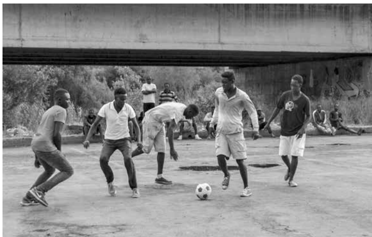
Scene di vita quotidiana a Ventimiglia, davanti il ponte

cui significato è no problem in curdo. Dopo l'esperienza nella preparazione e distribuzione di cibo per i migranti nel campo curdo di Grande-Synthe, nel Nord-Pas de Calais, questo collettivo di attivisti arriva sulla frontiera franco-italiana tramite la rete solidale della Val Roja per occuparsi della distribuzione alimentare e di beni di prima necessità, realizzando le proprie attività attorno a un grande camion-cucina da campo. Composto da un numero variabile di persone, da qualche unità a poche decine dipendendo dai periodi – con alcuni elementi stabili e un turn over importante – tale collettivo internazionale di ispirazione anarchica, svolge un ruolo chiave per il sostegno dei migranti al confine, distribuendo indicativamente da ottanta a novecento pasti al giorno, dipendendo dai periodi e dalla presenza contingente di transitanti sul territorio, inizialmente affiancando e in seguito arrivando a sostituire i volontari della Val Roja in tale attività.