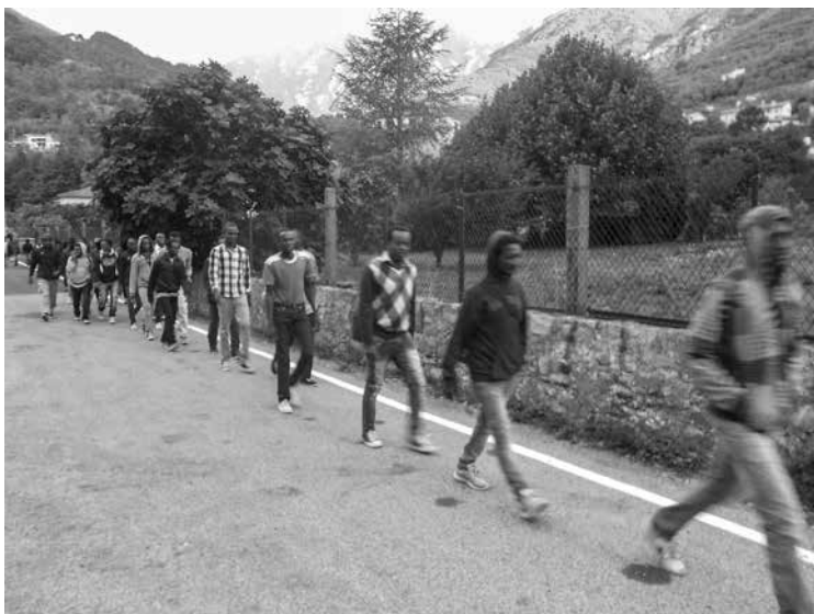
Migranti in transito dalla Val Roja verso Nizza, attraverso un corridoio legale organizzato dai solidali

un'offerta variegata di servizi da parte degli altri attori in campo: servizi di deportazione o incarcerazione, servizi di riconduzione all'accoglienza istituzionalizzata, ma anche servizi di passaggio e di supporto all'attesa, erogati non solo su base mercantile ma anche su base solidale.