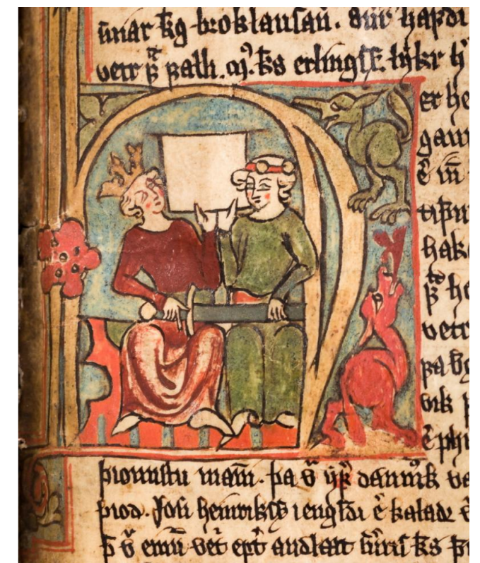
Hákon et Skúli (Flateyjarbók, fin XIV e siècle)