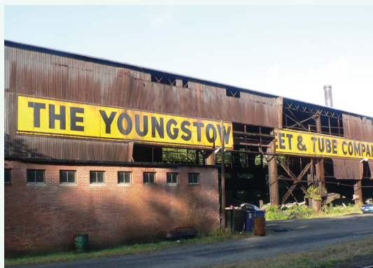
Une usine abandonnée de l'entreprise Youngstown Sheet and Tube Company, Octobre 2006.

Contexte : Le délitement de l'industrie sidérurgique a plongé la ville de Youngstown dans une phase de déclin économique et démographique. Face à l'échec des stratégies de redéveloppement menées depuis les années 80, la municipalité s'engage dans une démarche de "décroissance intelligente", concrétisée par la mise en place du Youngstown 2010 Plan.