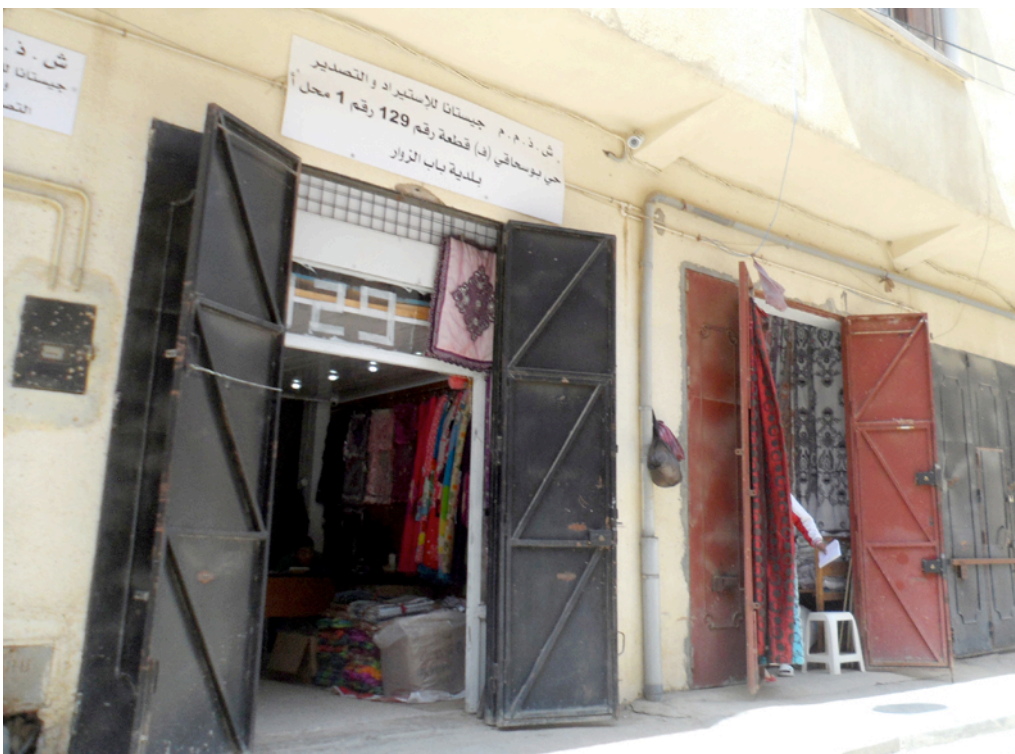
Fig. 2. Enseigne d'un commerce chinois rédigée en arabe

Traduction : SARL Jistana - Import Export. Cité Boushaki (F), lot 129, n° 1, Local A.