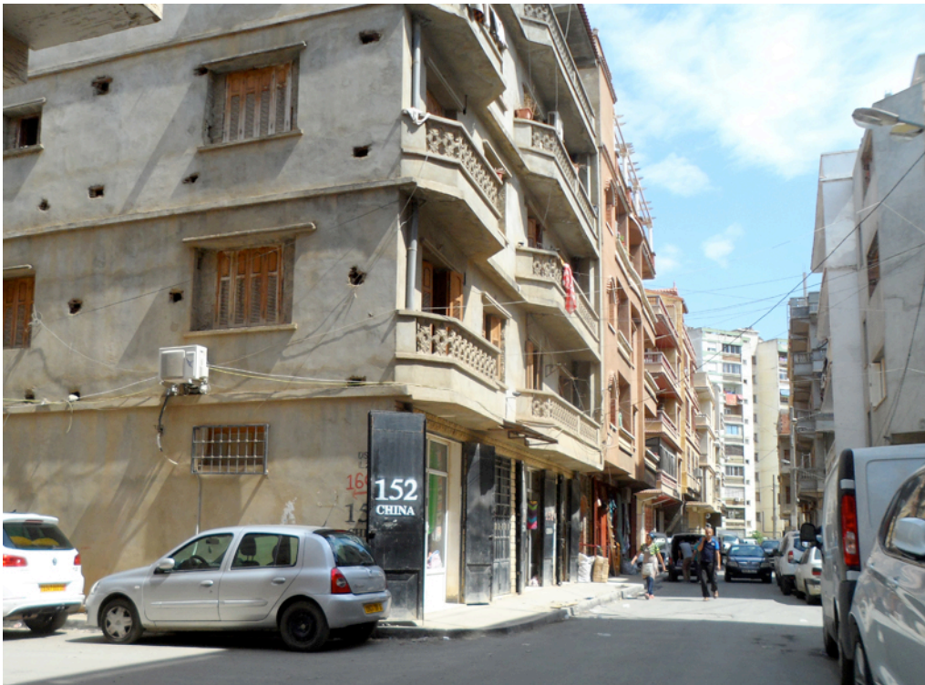
Fig. 1. Indication de la présence chinoise dans la cité Boushaki.