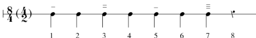
Fig. 1 : Cycle accentuel du compás por tangos 27